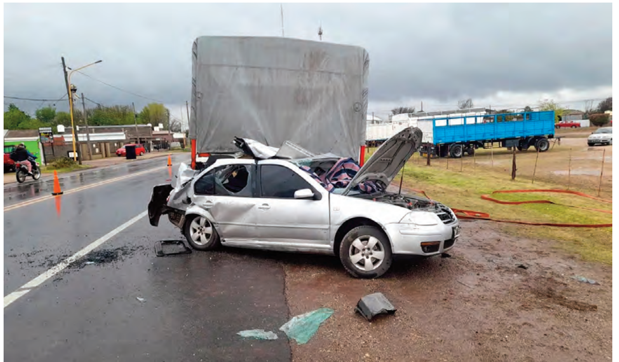
Los accidentes viales encienden luces amarillas en Córdoba.