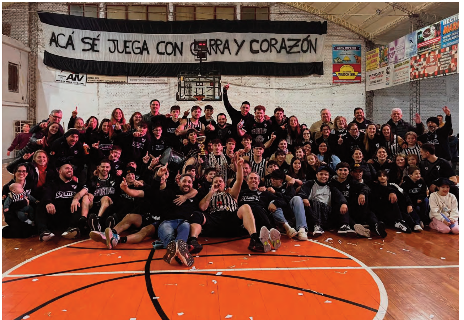
Sporting campeón de la primera edición del Torneo Interasociativo, venció en la final a 9 de Julio de Río Tercero.