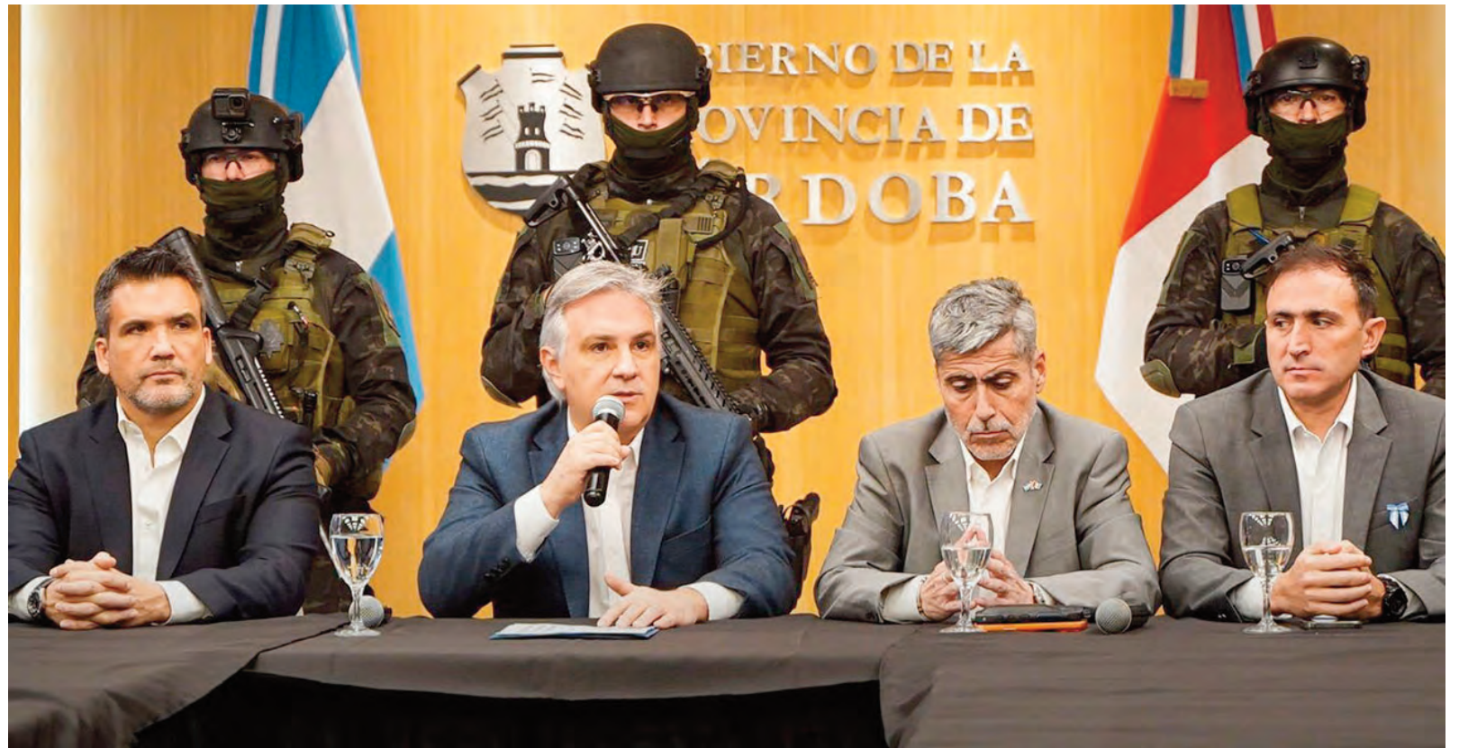
El gobernador Llaryora presentó ayer los puntos principales de la ley antibunkers.

“La ley busca dotar al Estado provincial de nuevas herramientas para intervenir inmuebles utilizados para la comercialización de drogas, actividades delictivas y situaciones de abandono que repre-