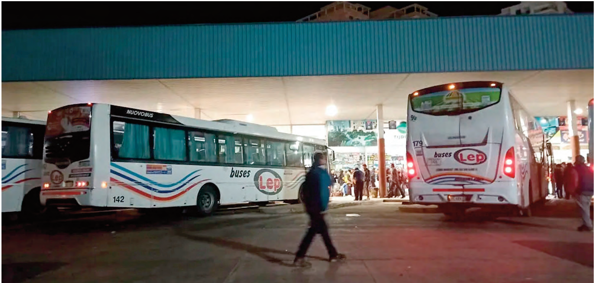
La Terminal de Ómnibus de Río Cuarto.

El Ejecutivo envió al Concejo un proyecto para extender la prestación de la estación terminal. La iniciativa contempla un aporte mensual de $18 millones por el alquiler de oficinas municipales. Está en comisión