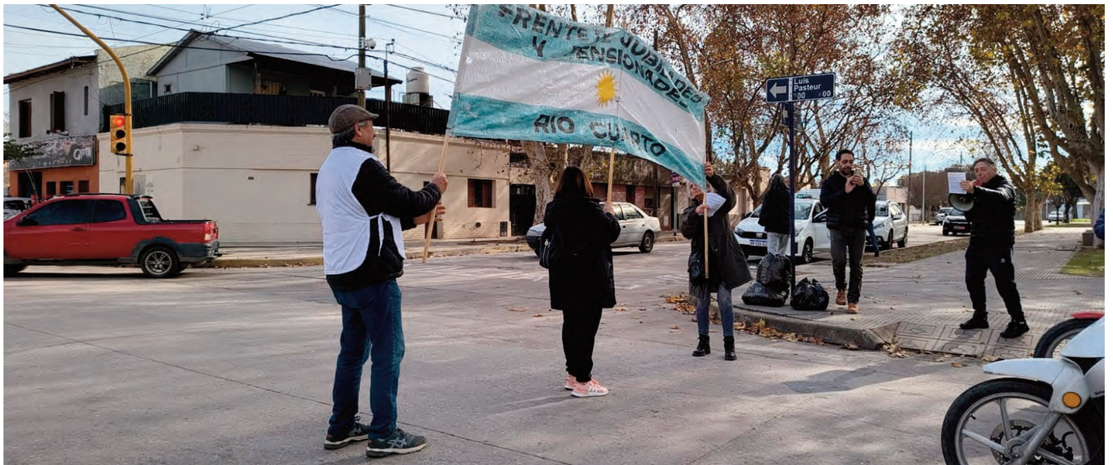
"Semaforazo" en el Alberdi.

PISCIS 22/02 - 21/03 Trabajo y negocios: un negocio o proyecto estancado se activa y se convertirá en un éxito. Amor: comprobará lo importante de agasajar a la persona amada y planear el futuro.