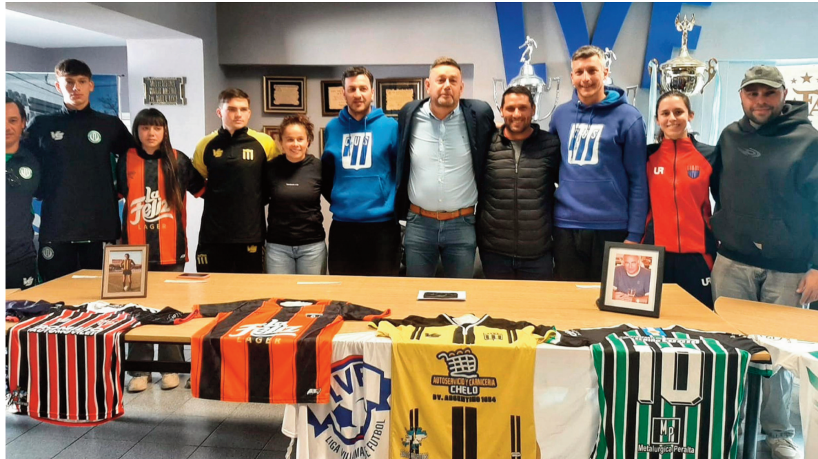
Se juega la final del Torneo Apertura "Municipalidad de Arroyo Algodón" de Primera "B" este domingo en Plaza Ocampo. A las 15.30 juegan Unión Central - Unión Social.