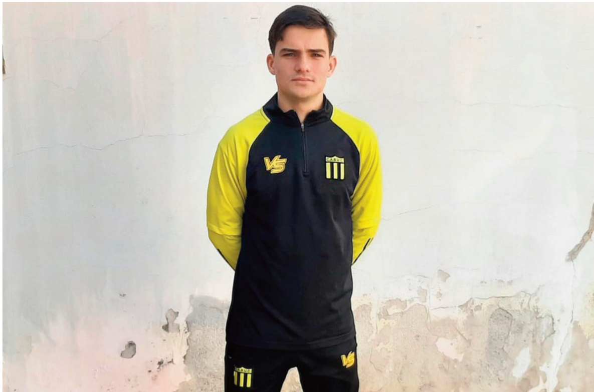
"Soñaba jugar una final con Unión Central en Plaza Ocampo. Fui alcanzapelotas en 2015, cuando enfrenté a Yrigoyen. Es un regalo de Dios está final", sostuvo.

"Suele pasar que para llegar arriba, primero hay que tocar fondo, y luego escalar. Unión es un club histórico de la Liga, el cuarto más ganador, y la gente nos pide el ascenso. Es lo que buscamos con Canelo".