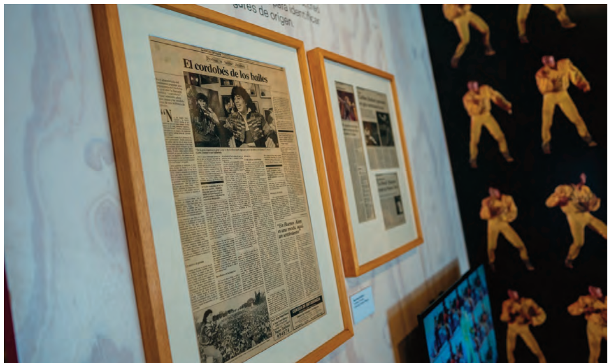
El recorrido muestra la evolución del cuarteto, desde sus inicios hasta la actualidad.

piano histórico que perteneció a la artista, y que durante años formó parte del patrimonio exhibido en el Cabildo, invitando a reflexionar sobre la importancia de preservar y resignificar estos objetos como parte de la memoria cultural.