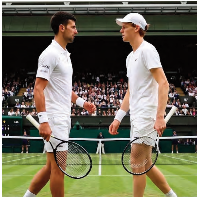
El plato fuerte de las semifinales será el cruce entre Jannik Sinner y Novak Djokovic.

Por el lado masculino, ya estaba confirmado el plato fuerte de esta instancia que será el enfrentamiento entre Jannik Sinner y