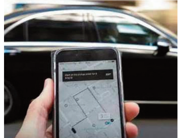
El Municipio comprometió controles más rigurosos para hacer cumplir la ordenanza 8.232.

Sobre ese punto, se definió que los prestadores puedan modificar el valor, pero sólo un 20% por en-