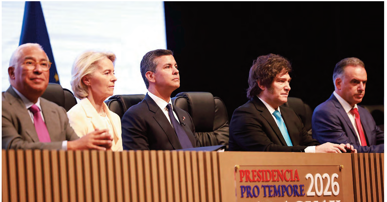
El 17 de enero se firmó el acuerdo Mercosur-UE en Asunción. El primer conflicto que enfrenta ese marco comercial es el de la soja y sus subproductos.

“La iniciativa de la Comisión no solo habría impactado negativamente en el desarrollo de la industria de aceite de soja a nivel global, sino que hubiera generado una restricción injustificada en nuestras exportaciones de manera in-