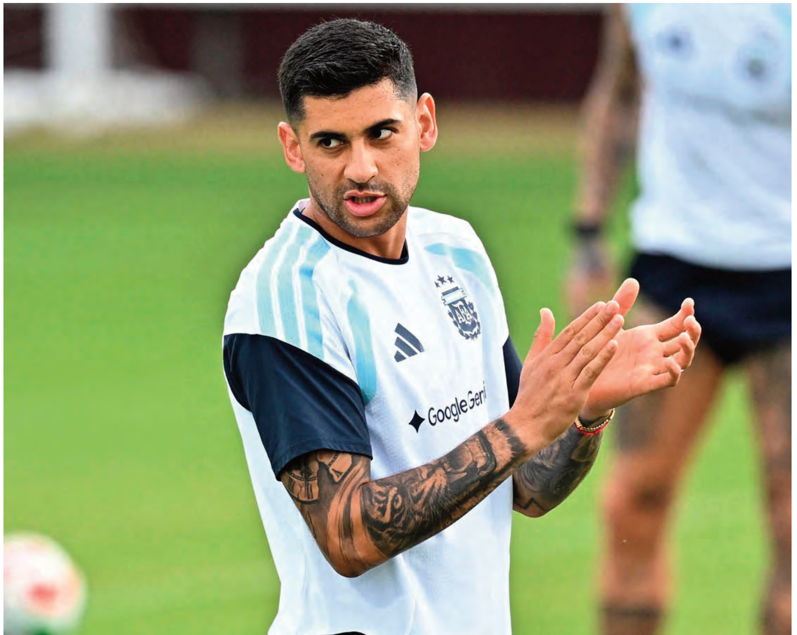
Romero finalizó el encuentro ante Egipto con su gemelo izquierdo cargado, pero no hay de qué preocuparse. El Cuti será de la partida el sábado por los cuartos de final.

Grupo de recuperación: Los futbolistas que sumaron la mayor