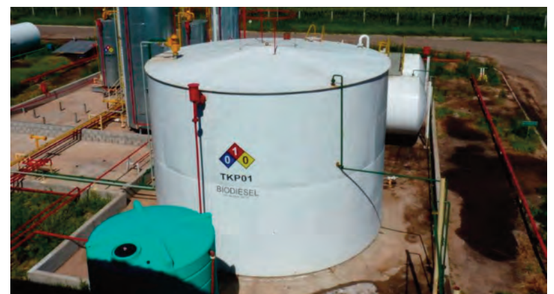
Las grandes productoras de biodiésel del país alertaron por el impacto del ILUC.

que la UE revise su régimen normativo para garantizar que se cumplan sus objetivos en materia de sostenibilidad sin generar obstáculos injustificados en el comercio, respetando los derechos y obligaciones consagrados en el ITA (acuerdo Mercosur-UE)”, indicó.