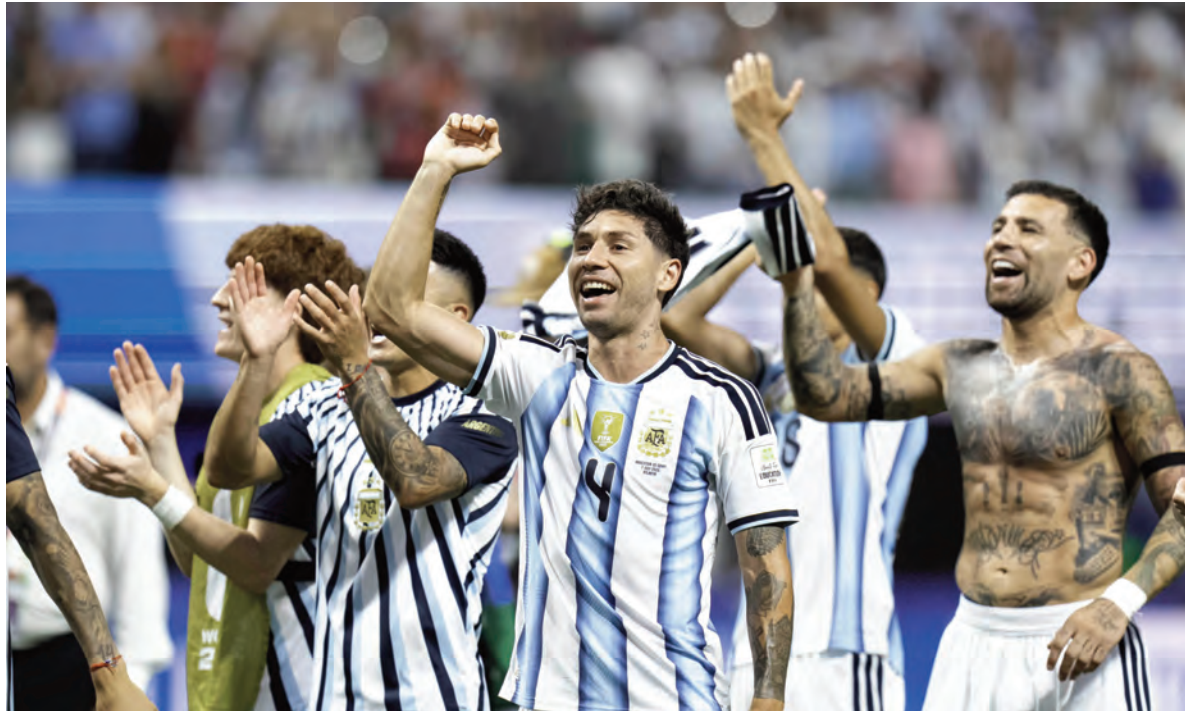
La Selección Argentina buscará llegar por quinta vez a una semifinal de un Mundial.

La segunda aparición de la Selección argentina en cuartos de final se dio recién en la inolvidable edición de México 1986. El rival en aquella ocasión fue nuevamente Inglaterra, rival al que los dirigidos por Carlos Salvador Bilardo vencieron 2-1 gracias a la "Mano de