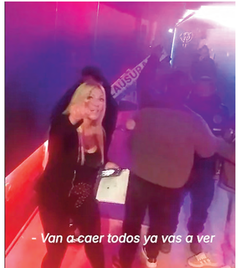
Mientras se colocaba la faja de clausura, la mujer apuntaba a los inspectores. imagen de video

Muñoz dijo que una vez que los trabajadores lograron colocar la faja de clausura preventiva para hacer cesar la actividad ilegal, “el mismo encargado rompió deliberadamente el precinto de seguridad para reabrir las puertas. Este acto configura un delito penal autónomo, tipificado en el Artículo 254 del Código Penal por violación de sellos y fajas puestos por la autoridad”.