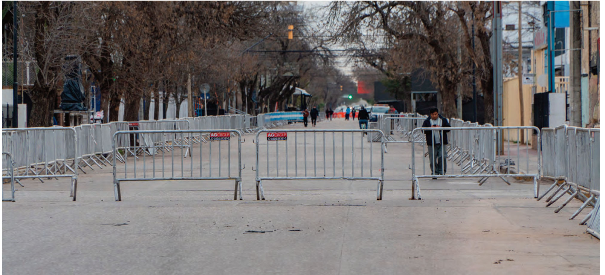
La zona de la avenida San Martín, donde se hará el desfile, ya con el vallado instalado. Abajo, el palco de las autoridades, listo.

Hoy se hará en la ciudad el acto central de la provincia. Habrá un desfile cívico-militar en la avenida San Martín. Desde el gobierno cordobés, el ministro Calvo destacó los anuncios que Llaryora viene haciendo para el sur