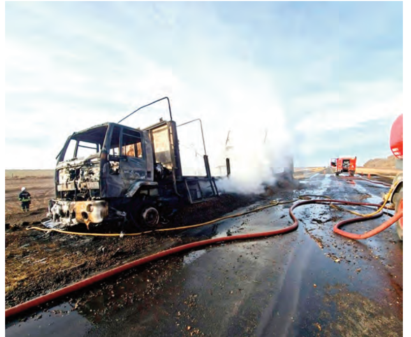
Los bomberos trabajaron más de cuatro horas para controlar el fuego en el camión.

El maní es de alta combustión cuando toma fuego, lo que derivó en un intenso trabajo para los bomberos, que al llegar al lugar encontraron el transporte envuelto en llamas.