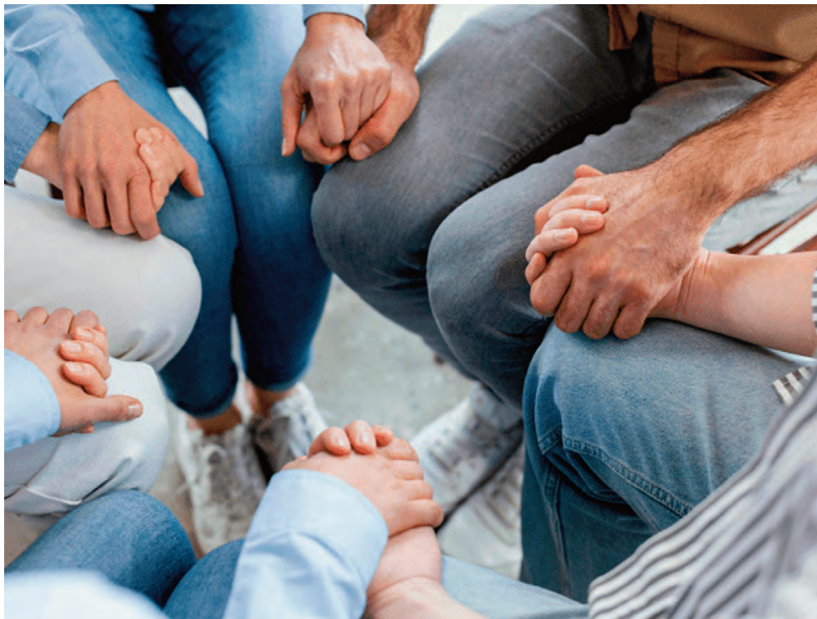
El Centro de Día será para la recuperación de adicciones.

En paralelo, se desarrollarán acciones concretas en favor de los adultos mayores”.