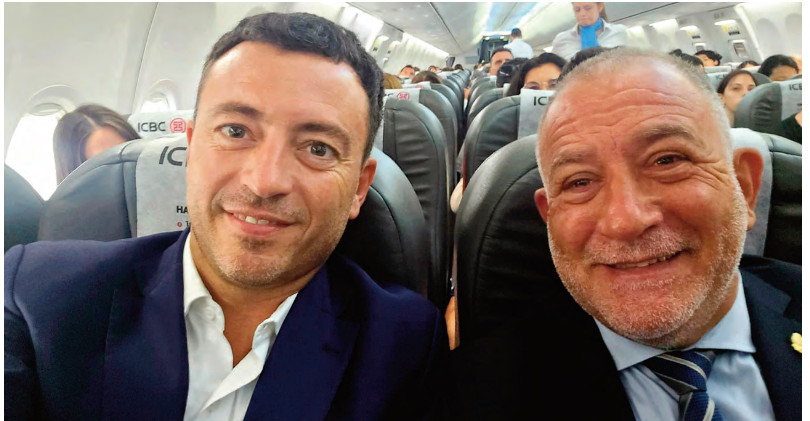
De Loredo y Juez se fotografiaron juntos ayer para desmentir rumores de distanciamiento. La Provincia los cuestionó por sus posturas en Buenos Aires.

dos legisladores no defiendan los intereses de Córdoba en el Congreso nacional.