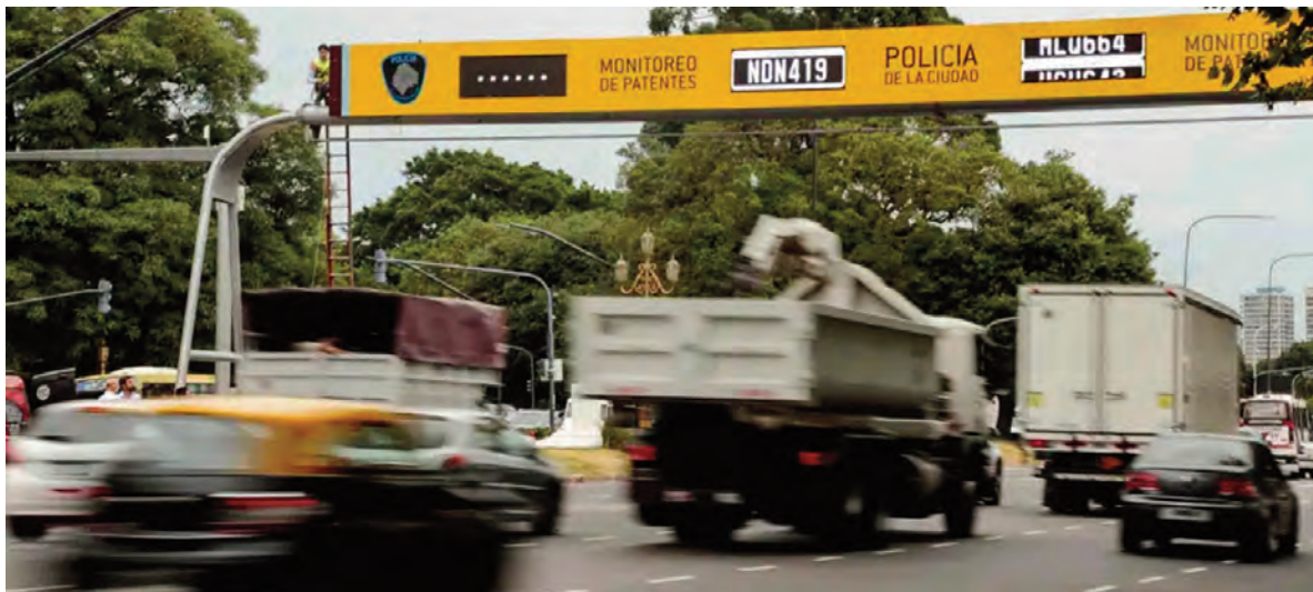
Anillo de Control.

puesto en seguridad fue incrementado en un 400%.