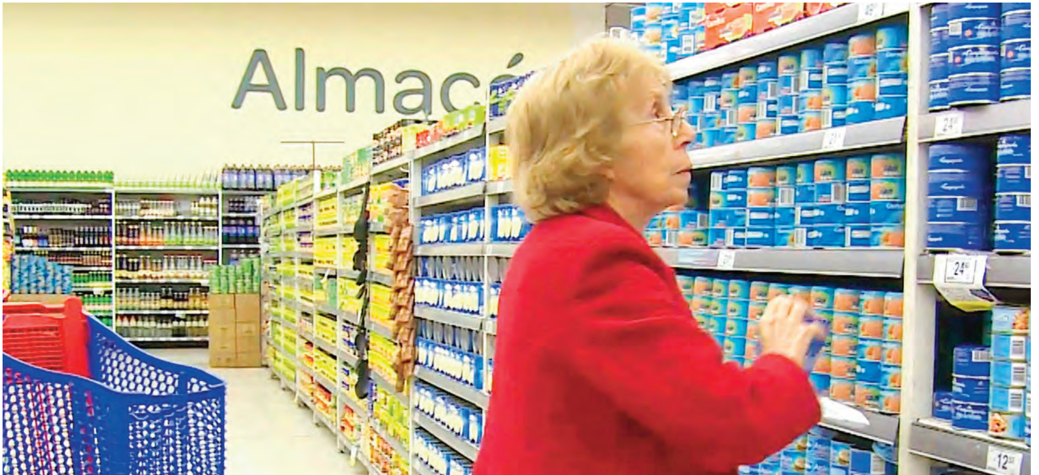
En los comercios de cercanía, las múltiples formas de financiamiento se fueron acentuando con el correr de los meses y a medida que los ingresos quedaron muy por debajo de la inflación.