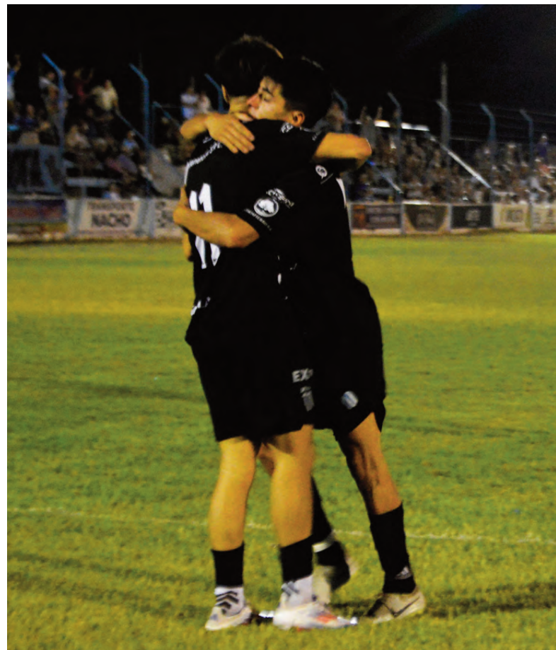
San Martín de Mackenna fue un canto al gol en su cancha.

Goleó 4 a 0 a su homónimo de Laboulaye y ahora se mide con el otro equipo que tiene el puntaje ideal en la zona 6, Jorge Ross de La Carlota