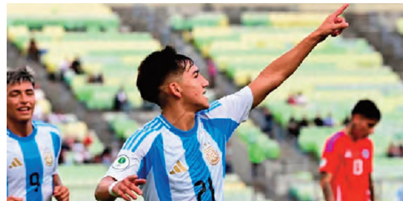
Argentina le ganó a Chile e hizo un paso importante rumbo al Mundial Sub-20.

Precisamente anoche, al cierre de esta edición y en un partido con score muy cerrado (a falta de 2'), Riachuelo de La Rioja le ganaba a Instituto de Córdoba por 69 a 60, en el partido que completaban los juegos de la Conferencia Norte.