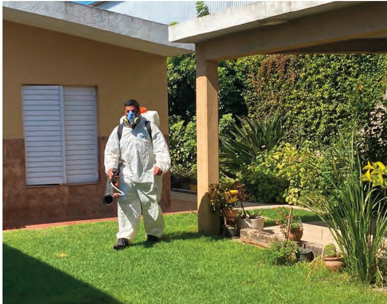
El trabajo consistió en la fumigación de los domicilios y jardines de frente y patios.

Además, se relevaron situaciones de riesgo ambiental, donde se solicitó el compromiso de los vecinos y mayor responsabilidad en la gestión de los residuos.