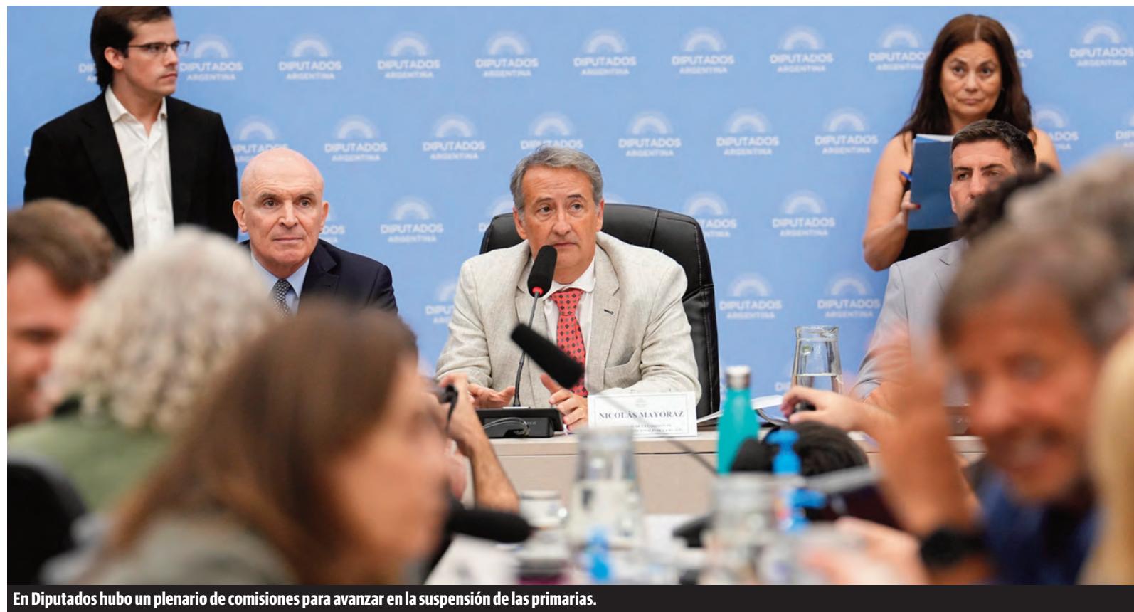
En Diputados hubo un plenario de comisiones para avanzar en la suspensión de las primarias.

Al final, el oficialismo consiguió dictamen para suspender las Paso