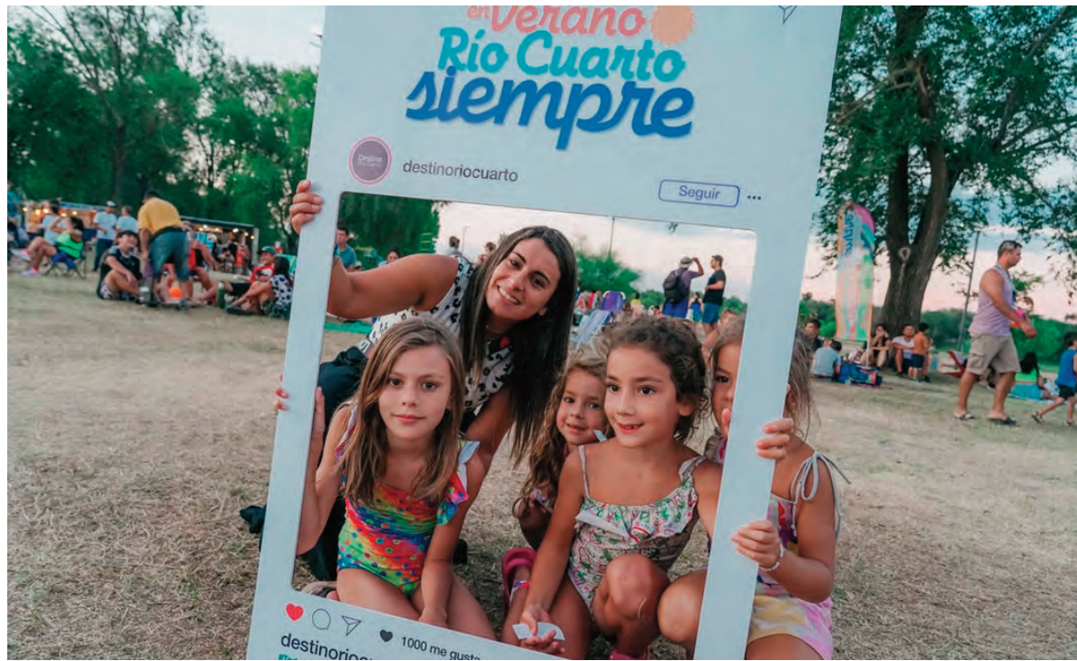
El Municipio puso en marcha una variada grilla de actividades para los meses de verano.

En tanto, en el corredor turístico de las Sierras del Sur se alcanzó un 81% de ocupación hotelera, con un promedio de tres noches de alojamiento y 2.819 turistas por noche. Cabe mencionar que la región presentó una amplia oferta de festivales, fechas durante las cuales se registró ocupación plena en los alojamientos locales y la deriva-