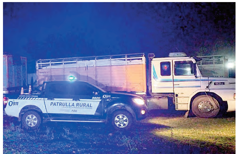
La Patrulla Rural Sur detectó el camión con la carga de maíz, sin la carta de porte.

La banda venía cometiendo robos tipo hormiga en el establecimiento rural de Del Campillo, a partir de las primeras pesquisas llevadas adelante por el personal policial y los testimonios recolectados por el Ministerio Público Fiscal.