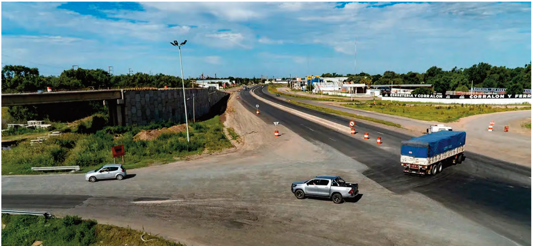
La Circunvalación es la mayor obra en la historia de la ciudad.