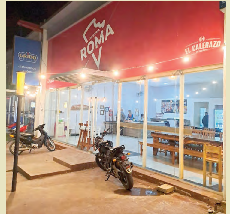
Uno de los adolescentes trasladados es muy conocido en el barrio.

Los involucrados tienen 16 y 17 años. Habían sustraído dinero y bebidas alcohólicas. Fue en un local ubicado en Francisco Muñiz al 1400