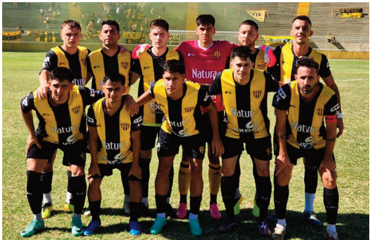
La alineación titular de Acción Juvenil que saltó al Bicentenario a jugar el partido ante San Lorenzo Alem de Catamarca.

En cuartos de final, llegó el clásico con Guaraní Antonio Franco