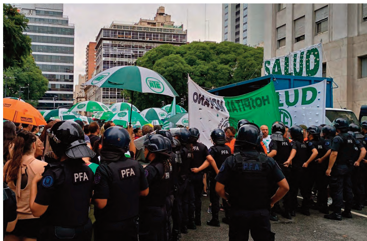
Fuerte cordón policial durante la protesta frente al Ministerio de Salud.

El exlegislador tenía un gran vínculo con el poder central y el año anterior votó en varias ocasiones junto al oficialismo.