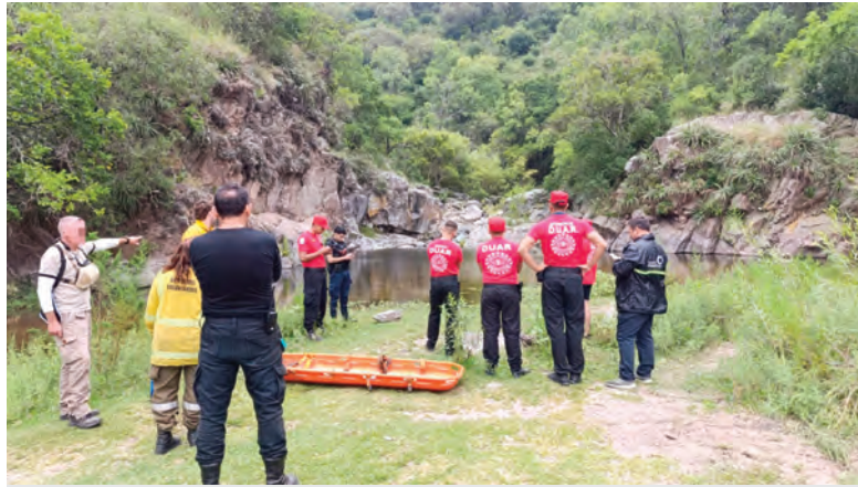
En la tarea de reanimación del joven intervino personal del DUAR.

Se practicaron las tareas de reanimación sin éxito, para parte del personal especializado del Duar, se