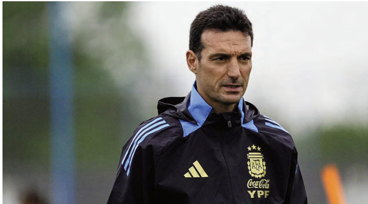
Scaloni aseguró que tiene pensado "darle oportunidades a chicos que todavía no han estado" en el equipo.

En su última convocatoria, en la que la selección se enfrentó a Paraguay y Perú, Scaloni llamó a un par de caras no tan habituales que buscarán afirmarse para el Mundial de Estados Unidos, Canadá y México 2026, como los defensores