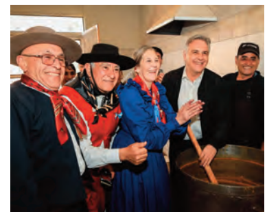
Revolviendo el locro.

Locro criollo, mateada al aire libre, kermés popular y shows gratuitos, el lado B de la visita