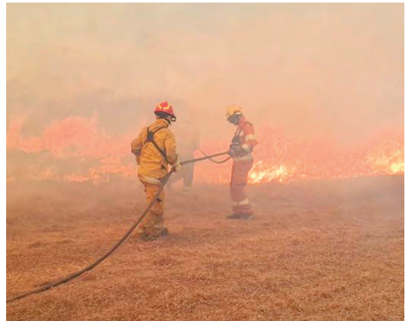
Para la Provincia, ya se inició la temporada de incendios forestales.

El operativo realizado en La Calera puso en evidencia la capacidad de despliegue del Sistema Provincial de Manejo del Fuego, fortalecida recientemente con la incorporación de nuevas aeronaves a la flota de la Dirección Provincial de Aeronáutica.