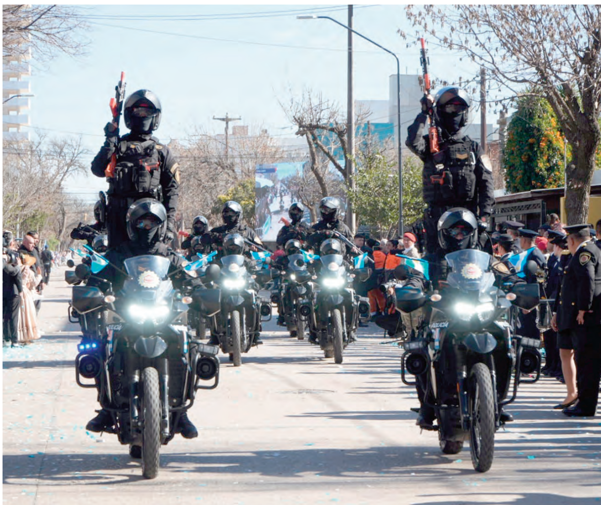
El desfile patrio tuvo, ayer, toques acrobáticos.