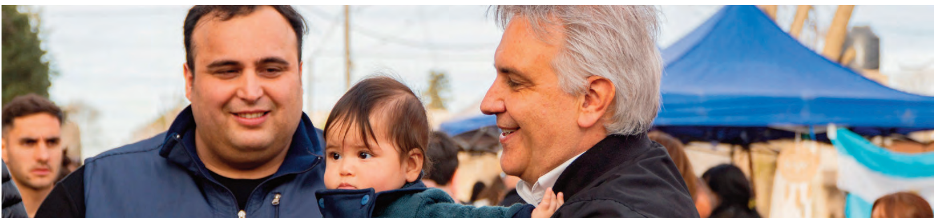
Distendido, Llaryora habló por la tarde con los vecinos del barrio Alberdi, en el marco de la obra de pavimento que fue inaugurada.

El Plan de 100 Cuadras de Pavimentación ya supera el 60 por ciento de avance, según se informó oficialmente.