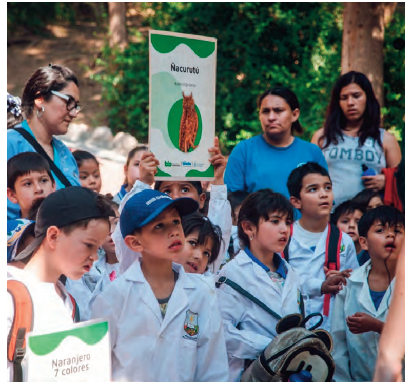
El programa garantiza el traslado gratuito de los chicos.

También forman parte de los recorridos el Parque de la Biodiversidad y el Jardín Botánico, espacios que promueven el conocimiento de la flora y la fauna, el cuidado del ambiente y la valoración de los espacios verdes como