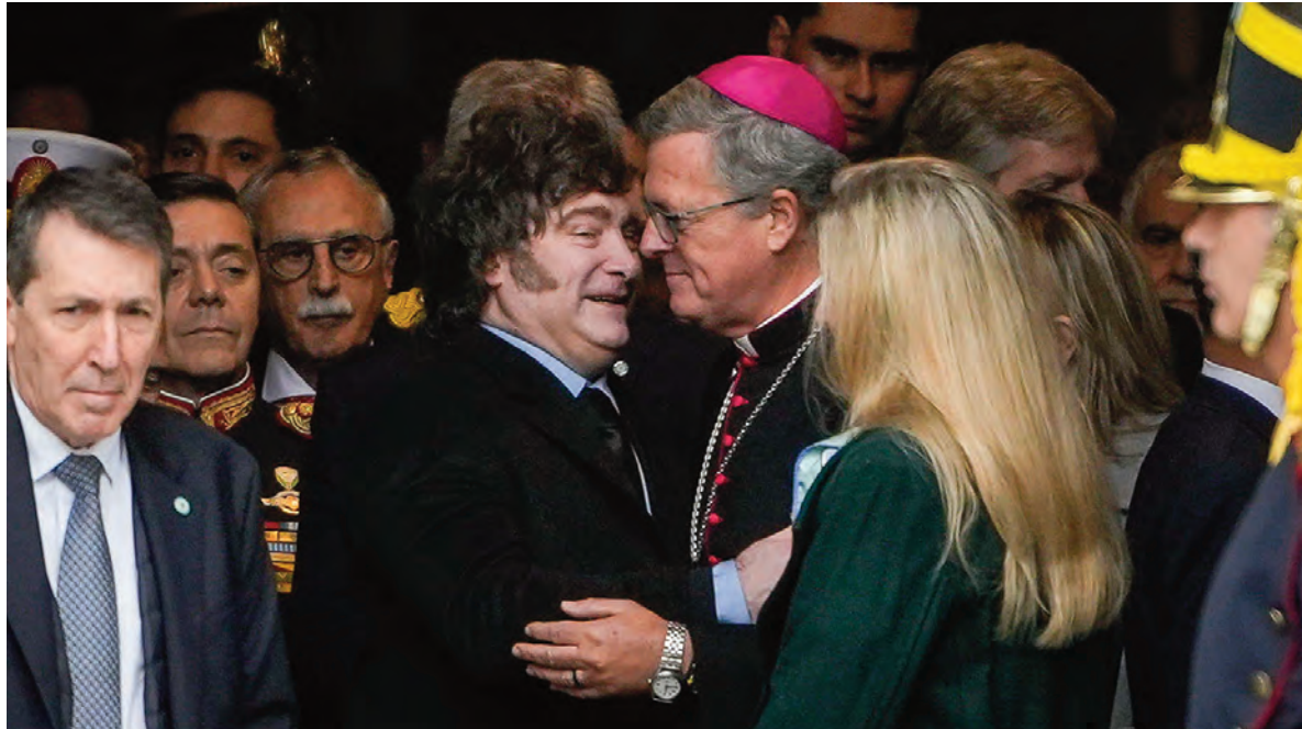
Milei y García Cuerva se saludan en el ingreso a la Catedral.

Al llegar a las puertas del templo, al Presidente lo recibió el padre Alejandro Russo, a cargo de la Catedral, y juntos ingresaron. De in-