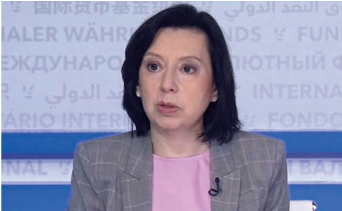
La vocera Kozack también dio su apoyo a la reforma de la Carta Orgánica del BCRA.