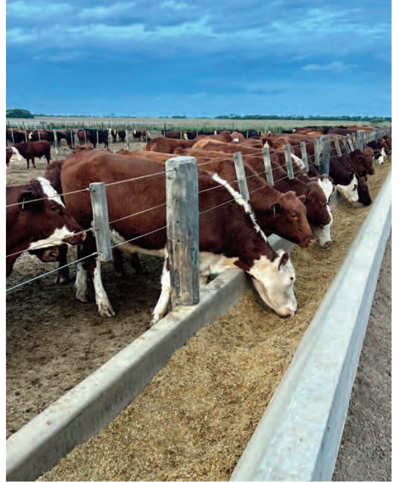
Los feedlots están aprovechando a cargar kilos baratos en la hacienda.

El resultado económico alcanzó en marzo su mejor momento en el año, cuando la primera columna arrojó 164.296 pesos y la segunda, $ 63.121, ambos positivos. Pero en el comienzo del año los datos eran