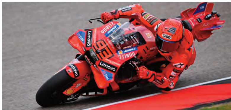
El campeón Marc Márquez llega totalmente recuperado al Gran Premio de Alemania.