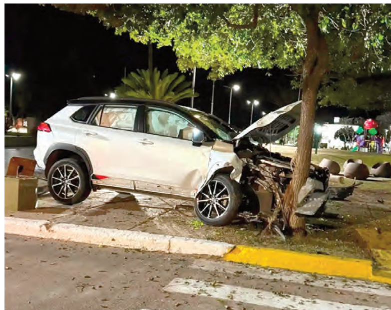
El Toyota quedó sobre la vereda, tras impactar contra el árbol.