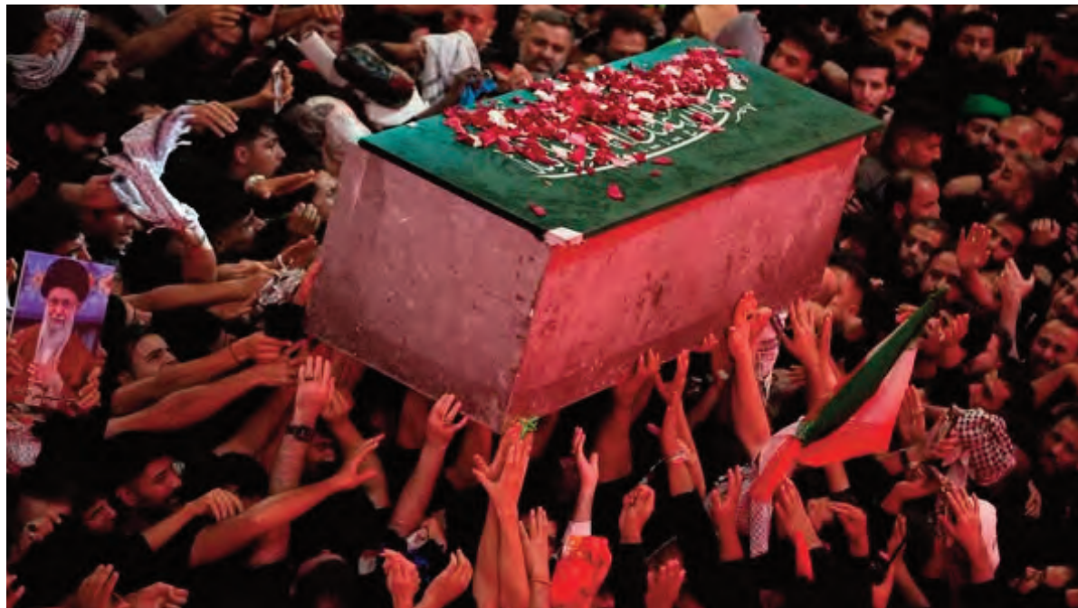
Pese al clima de tensión, miles de fieles acudieron a la ciudad nororiental iraní de Mashad para asistir al entierro del asesinado líder supremo Alí Jamenei, al término de seis días de ceremonias que reunieron a millones de personas en distintas ciudades de Irán e Irak. Numerosas mujeres de todas las edades, vestidas con chadores negros, se congregaron a lo largo de la avenida que conduce al santuario del imán Reza, el lugar más sagrado del islam chiita en Irán, en medio de amenazas de venganza contra Estados Unidos y el presidente Donald Trump.

En la provincia suroccidental iraní de Juzestán, al menos tres personas murieron ayer, según reportaron medios estatales.