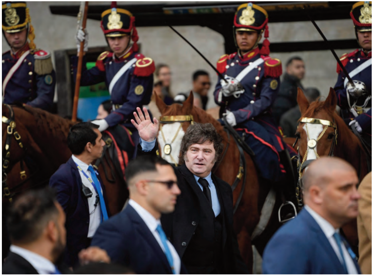
Milei fue caminando desde la Casa Rosada hasta la Catedral metropolitana.

Uno a uno, el mandatario presentó a ministros y colaboradores mientras los presentes aplaudían. Se llevaron las mayores reacciones la senadora Bullrich y el ministro coordinador, Diego Santilli.