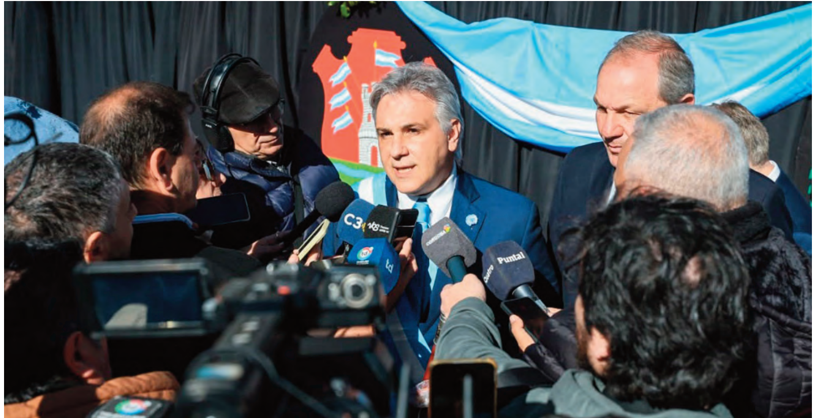
El gobernador habló con los medios de comunicación después del desfile cívico-militar.

El mandatario destacó los resultados que las fuerzas de seguridad provinciales están consiguiendo