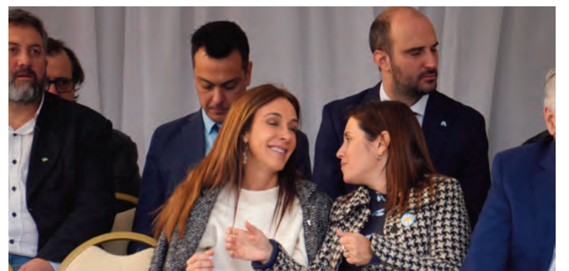
La diputada libertaria Belén Avico se hizo presente en el desfile.