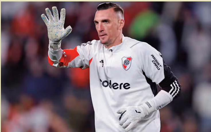
Armani jugó 366 partidos y ganó 10 títulos con la camiseta de River.