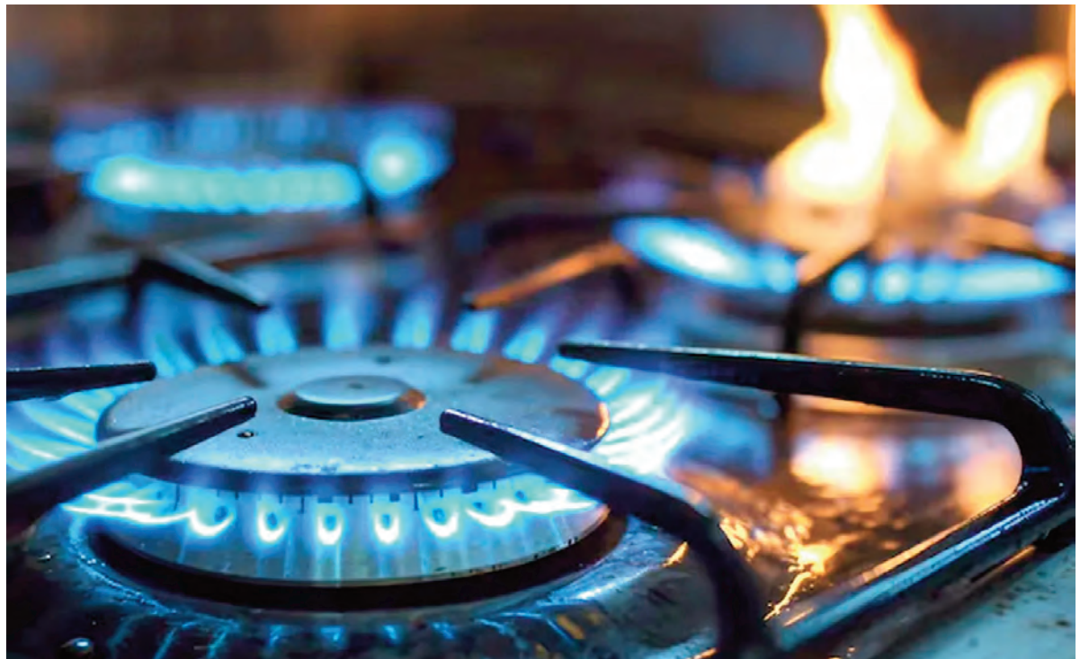
La eliminación de la Zona Fría provocaría fuertes aumentos en las boletas de gas en Córdoba.

El gobernador agregó: “Ya nos llevan plata por retenciones, y ahora esa plata también va a salir de acá. Nosotros peleamos mucho para estar incorporados como Zona Fría. Entonces, más allá de la relación que tenga con el ministro Santilli, eso no va a influir en la postura que pueden tener ellos desde el gobierno nacional y nosotros como gobierno provincial. Yo tengo que defender los intereses de los cordobeses, ese es el mandato que me dieron los cordobeses. Por lo tanto, cuando veo