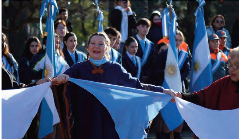
En la Plaza San Martín, el Ballet de Adultos Mayores interpretó el tradicional Pericón Nacional.