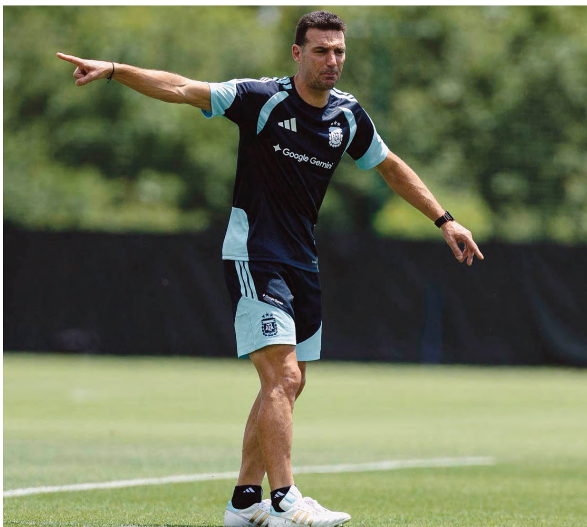
Lionel Scaloni define la estrategia en Kansas City: el entrenador evalúa variantes tácticas y cuida al plantel de cara al cruce decisivo ante Suiza por los cuartos de final.

En los laterales de la defensa permanecen las dudas. Por derecha, Gonzalo Montiel tuvo un ingreso aceptable y podría imponerse por