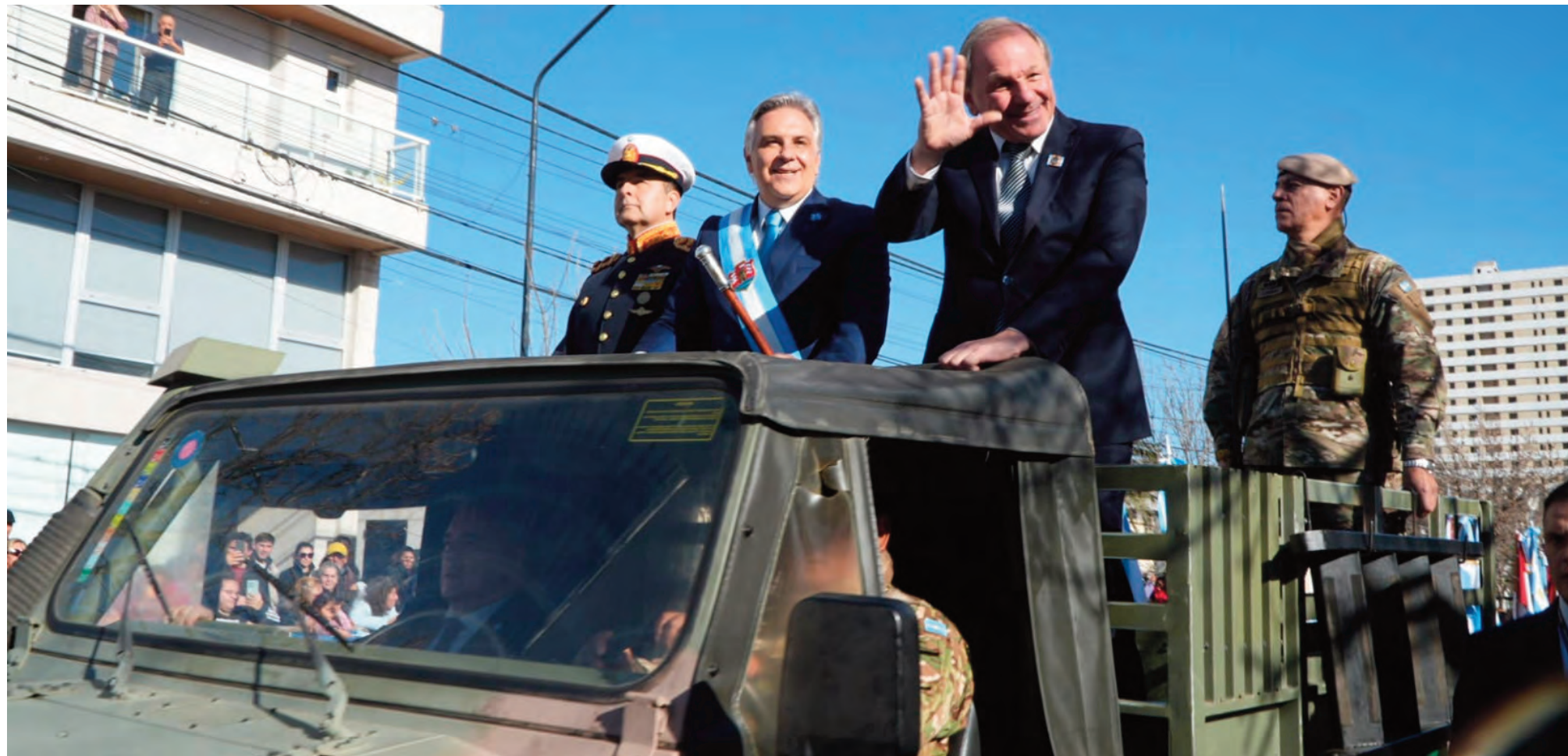
Llaryora pasa revista junto a De Rivas en el masivo desfile por el 9 de Julio.

Con la participación de más de 2.000 efectivos e integrantes de instituciones educativas, sociales, culturales y de seguridad, la ciudad celebró el 9 de Julio. Con banderas y camisetas de la Selección, los vecinos acompañaron