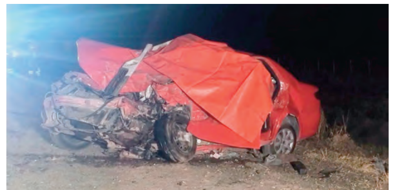
Dos de los ocupantes del automóvil murieron en el lugar del impacto.

La ruta estuvo cortada al tránsito vehicular durante varias horas hasta que terminaron las pericias, mientras se determinó el paso por caminos alternativos para los automovilistas que circulaban por el sector.