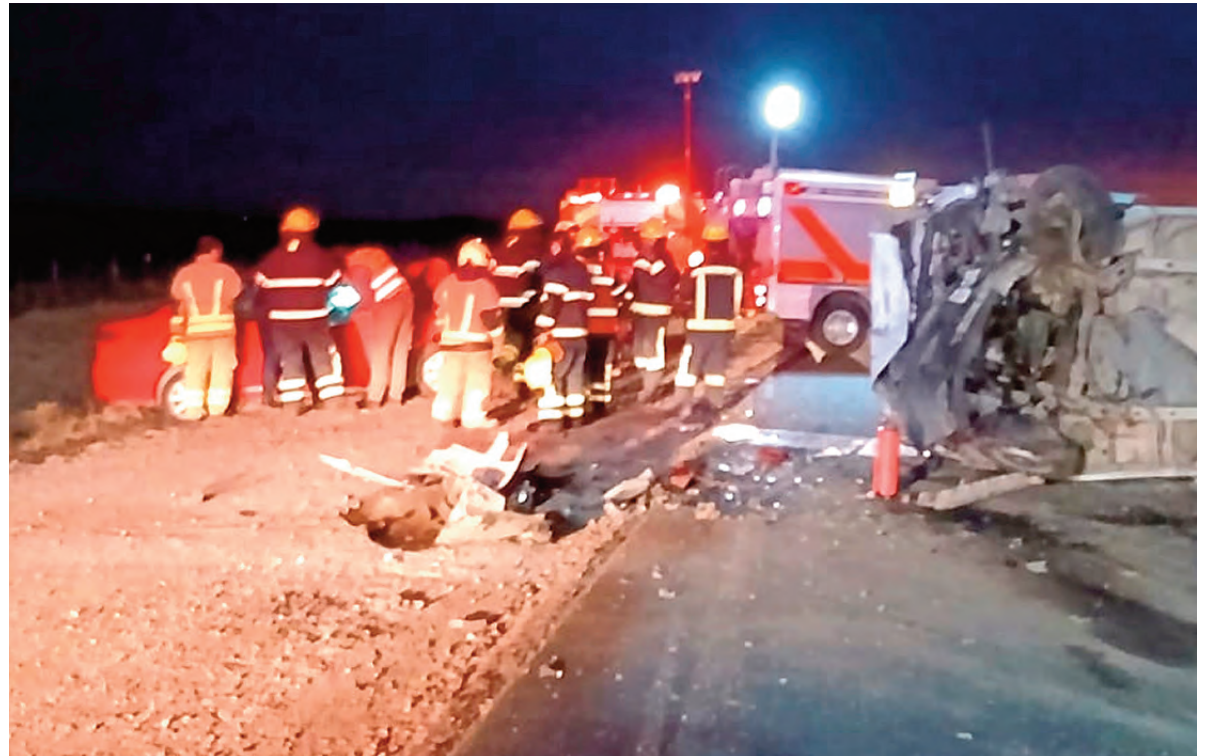
La combi con 16 personas terminó volcando sobre un costado, tras el impacto con el Fiat Siena.

Por directivas de la Fiscalía de Instrucción de La Carlota se ordenó a personal de Policía Científica que realice las pericias métricas y fotográficas para determinar las posibles causas de la tragedia vial, que conmociona a una