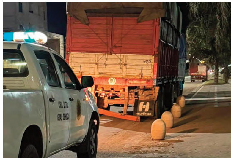
La moto que conducía Rodríguez impactó en el sector del paracolpe del camión.

Los restos de Rodríguez son velados en la sala N° 3 de Servicios Sociales Lizio hasta las 11 de hoy. Se observaron muestras de dolor de familiares y amigos por su repentina muerte.