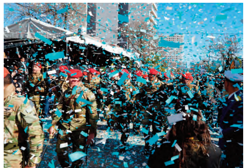
Los infaltables papelitos patrios.