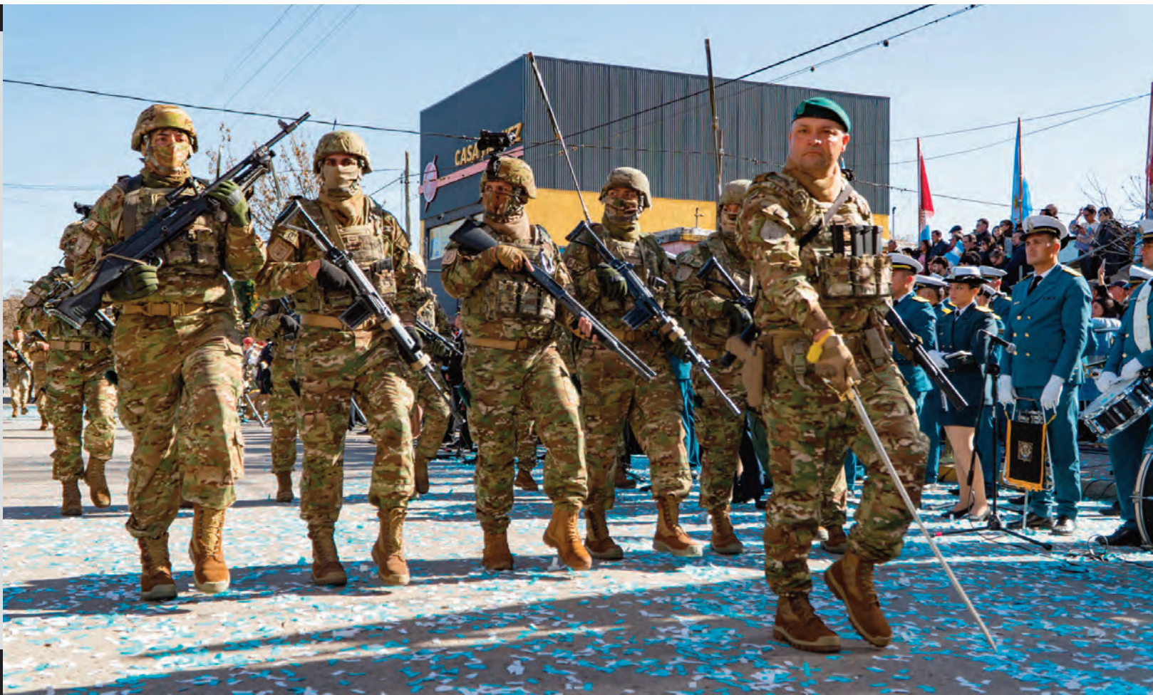
Las fuerzas militares, durante su paso frente al palco oficial.