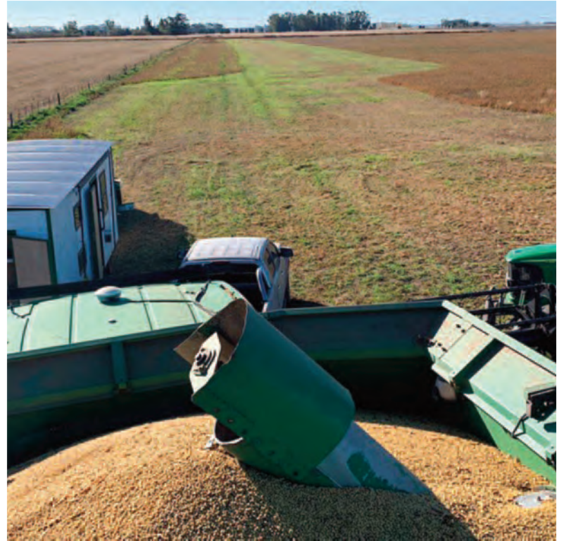
El volumen de granos alcanzado en este ciclo sería de unas 164 millones de toneladas.

En segundo lugar, en septiembre de 2025 rigió la eliminación temporaria de retenciones, que adelantó el ingreso de divisas en esos meses, pero redujo el monto liquidado en los meses subsiguientes.