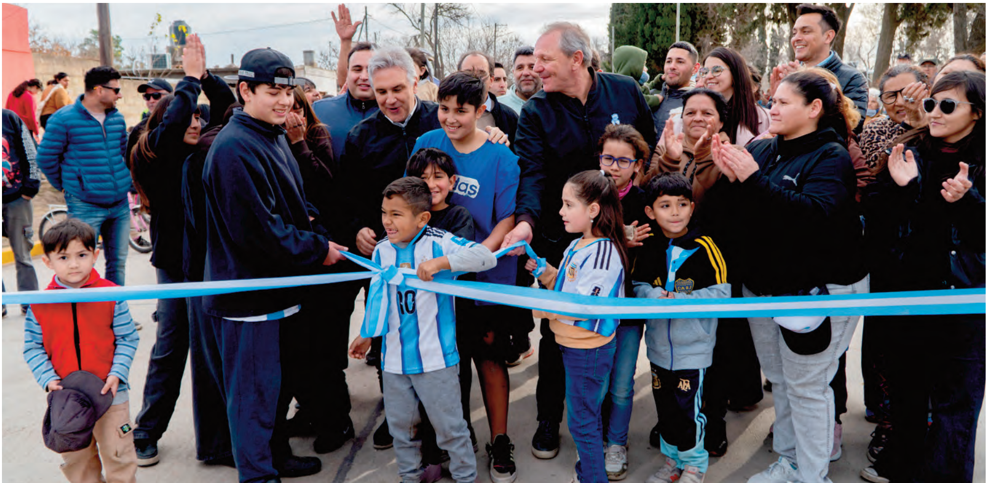
Inauguran nuevas cuadras de asfalto.