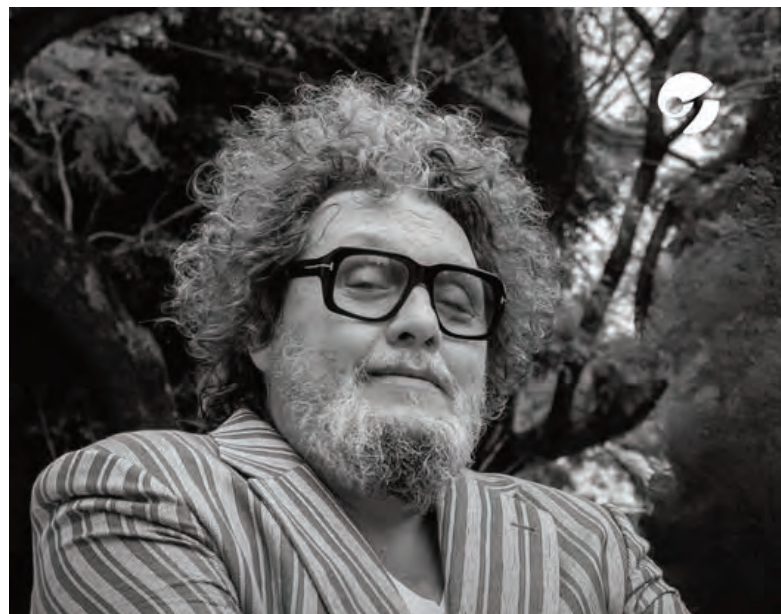
Agulla tenía 62 años.