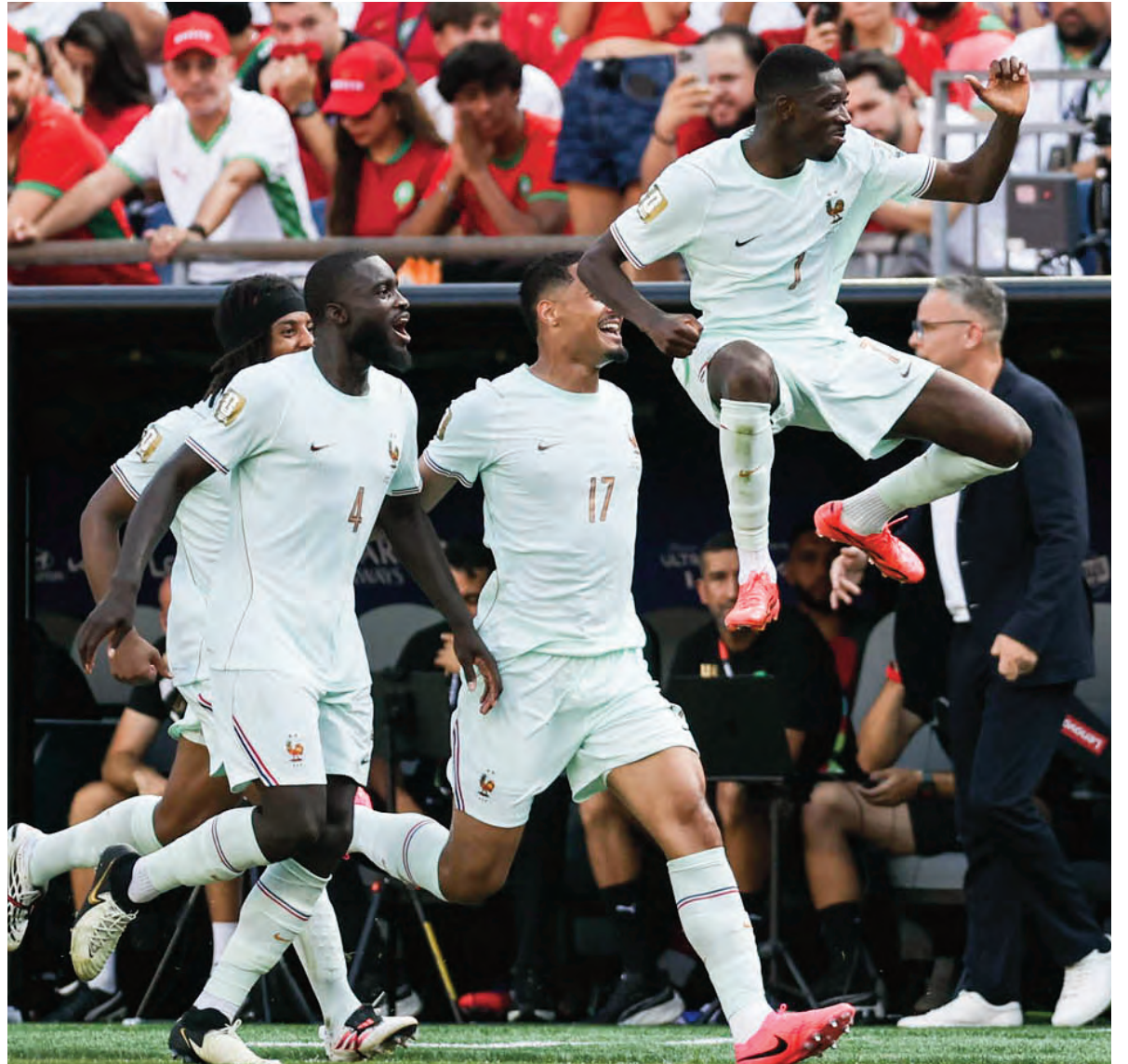
Ousmane Dembele festeja su gol, el segundo en el triunfo de Francia sobre Marruecos y el quinto en su marca personal en este torneo.

Marruecos buscó descontar con un remate de Azzedine Ounahi que controló Mike Maignan y un cabezazo de Neil El Aynaoui que