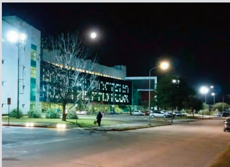
Fueron insuficientes los esfuerzos. En el Pasteur se constató la muerte del pasajero.

El cordón sanitario que se activó de la Terminal al Pasteur no fue suficiente para reanimar al pasajero, que fue declarado muerto en el nosocomio