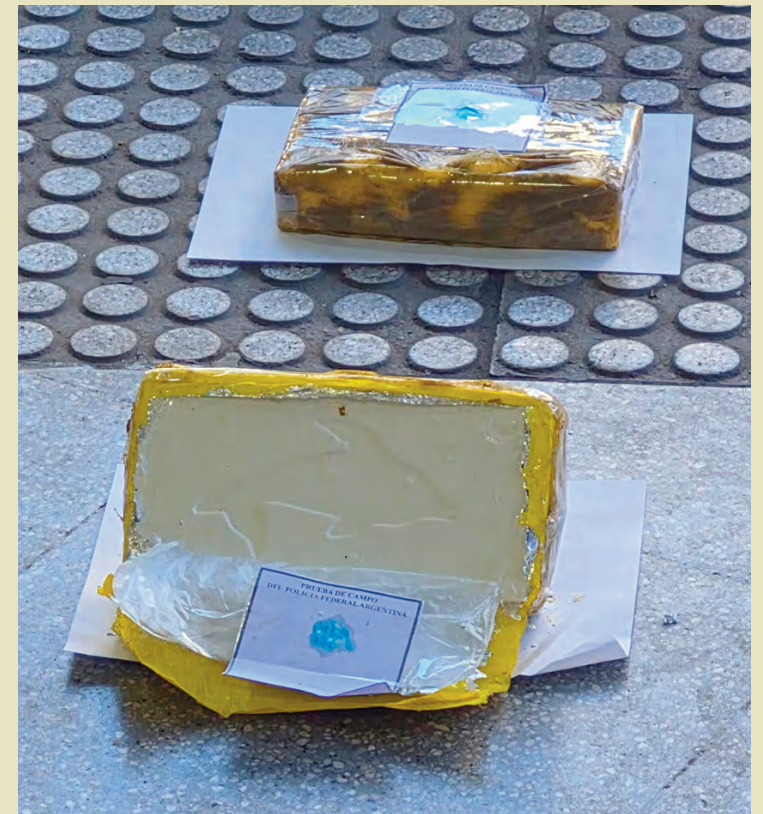
La droga tenía el sello de un delfín, de la banda "El Patrón del Norte".

Estaba en la bodega de un micro que había salido desde Jujuy. Dos mujeres detenidas