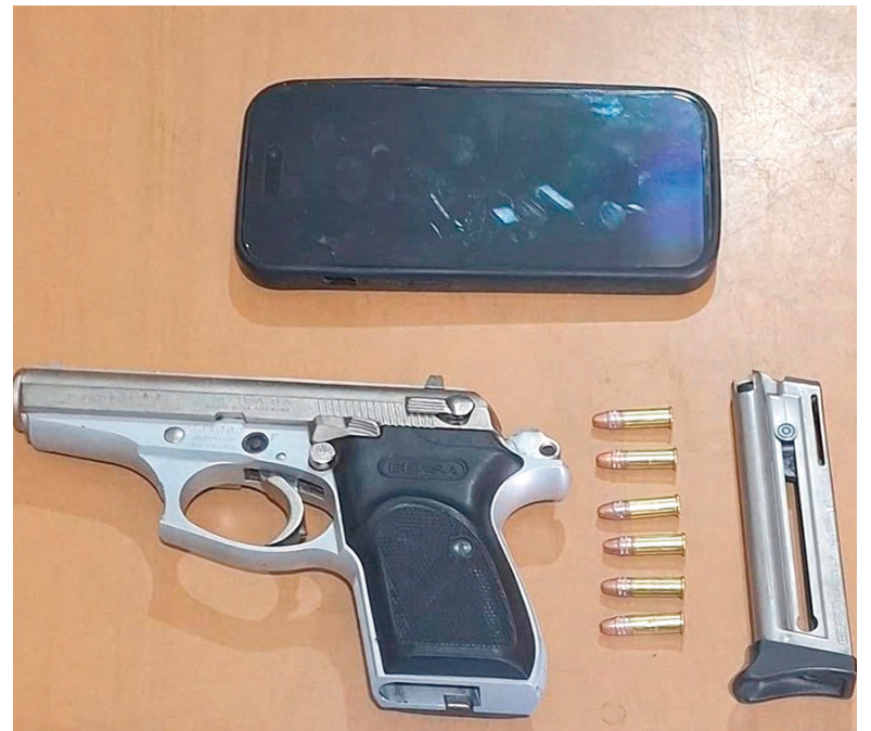
Los elementos secuestrados al autor de los disparos.