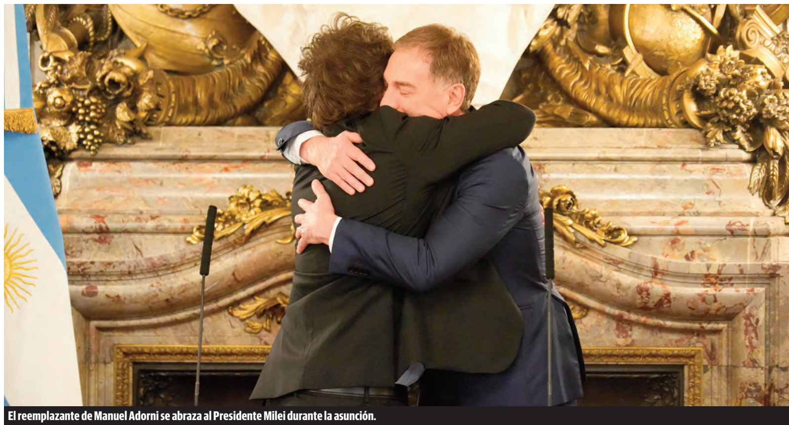
El reemplazante de Manuel Adorni se abraza al Presidente Milei durante la asunción.

Santilli juró como jefe de Gabinete y prometió avanzar con las reformas