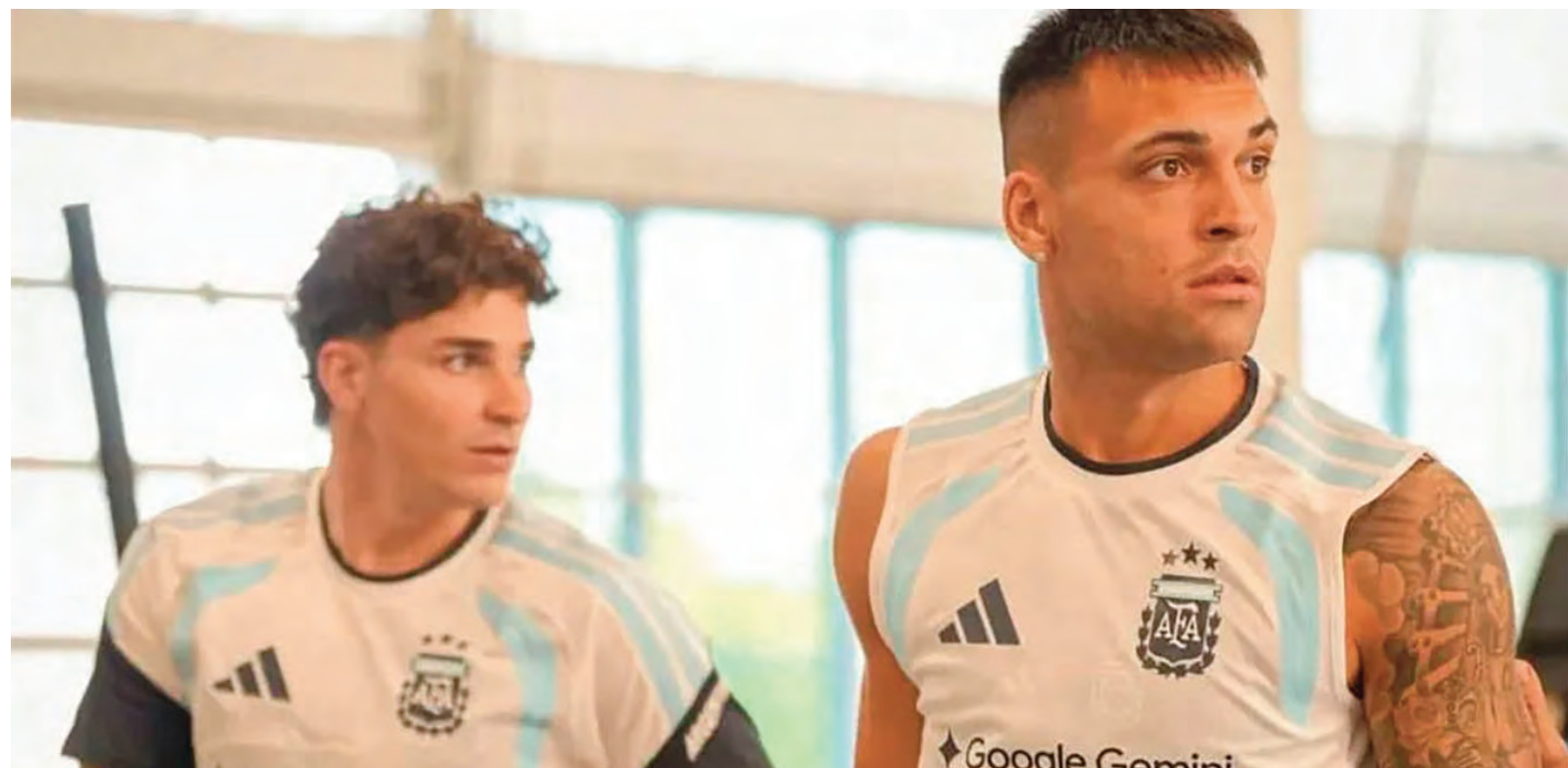
Lautaro tiene ventaja sobre Julián para estar desde el inicio el próximo viernes ante Cabo Verde por los 16avos de final.

En el entrenamiento a puertas abiertas que brindó la Selección argentina en Kansas, se pudo ver al defensor trabajando a la par del grupo.