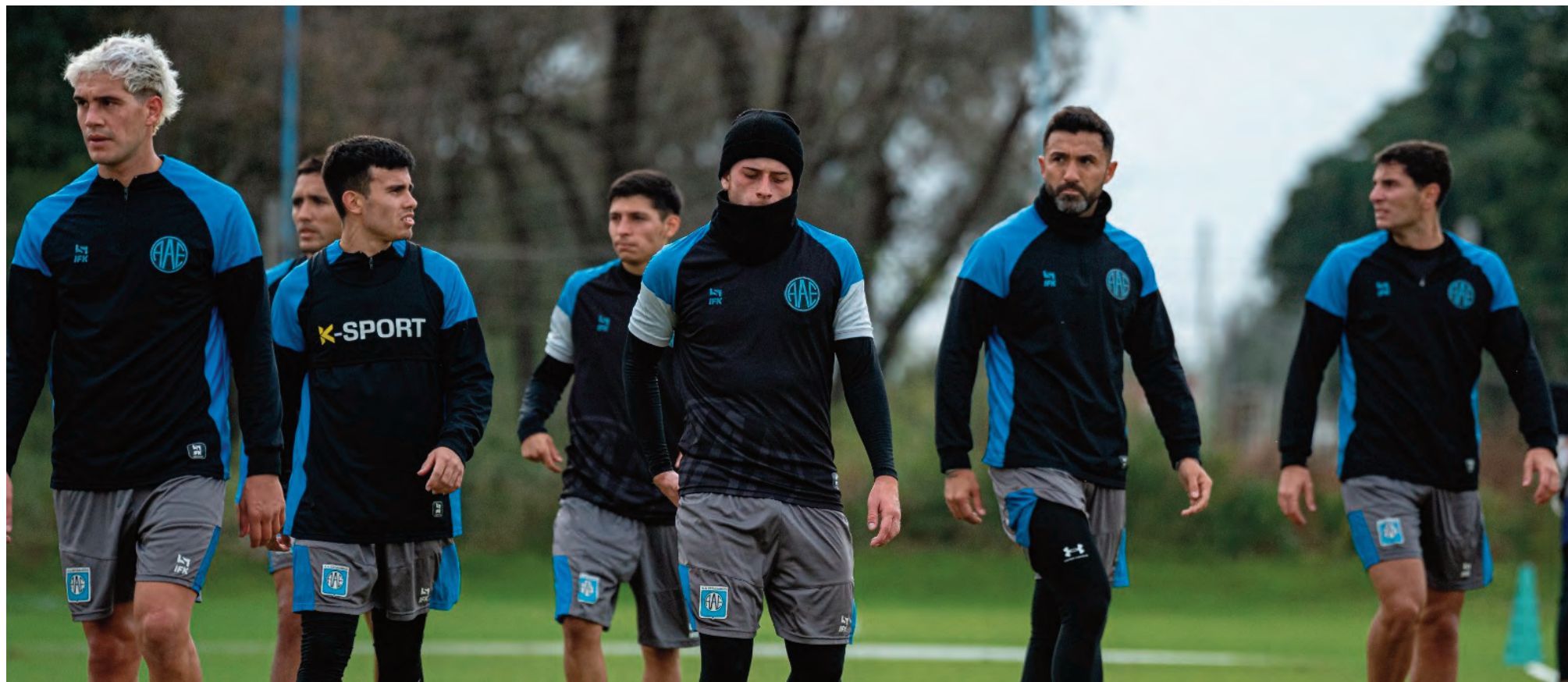
El plantel de Estudiantes, concentrado en Córdoba, se prepara para su primer amistoso de pretemporada pensando en el Clausura 2026.