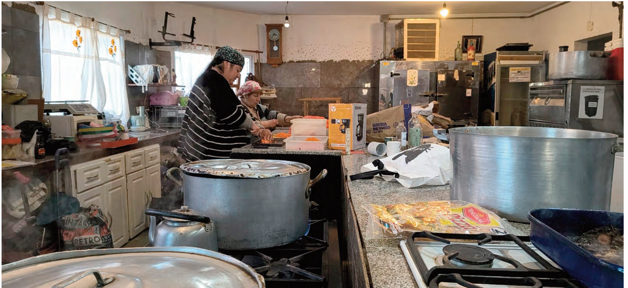
Los comedores barriales no dan abasto.