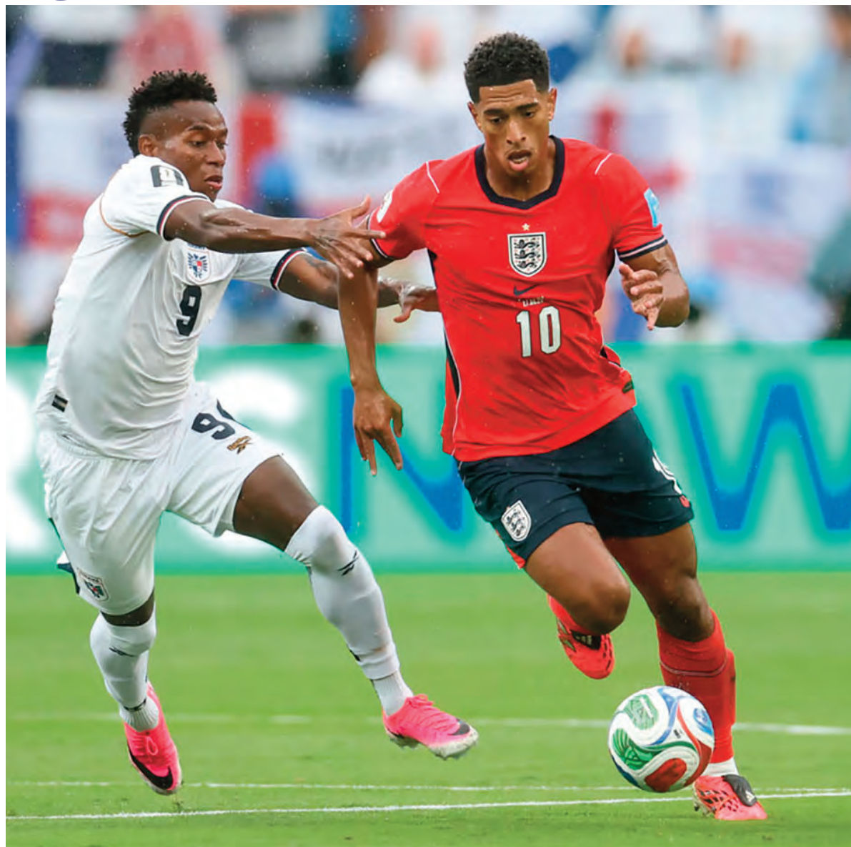
Jude Bellingham, jugador del seleccionado de Inglaterra que terminó primero en el Grupo L.