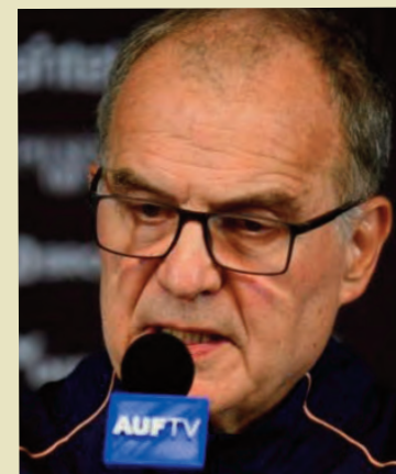
Bielsa calificó a su despedida de "dolorosa", ya que se había hecho grandes ilusiones en su tercera participación en una cita mundialista y pidió disculpas por haber "decepcionado a los aficionados".

Luego de aclarar que mantiene la "convicción" de que el resultado no se habría modificado en caso de que el entrenador "hubiera optado por caminos diferentes" a los que optó, Bielsa volvió a destacar, como lo hizo en la conferencia de prensa posterior a la derrota con España, que su seleccionado mereció