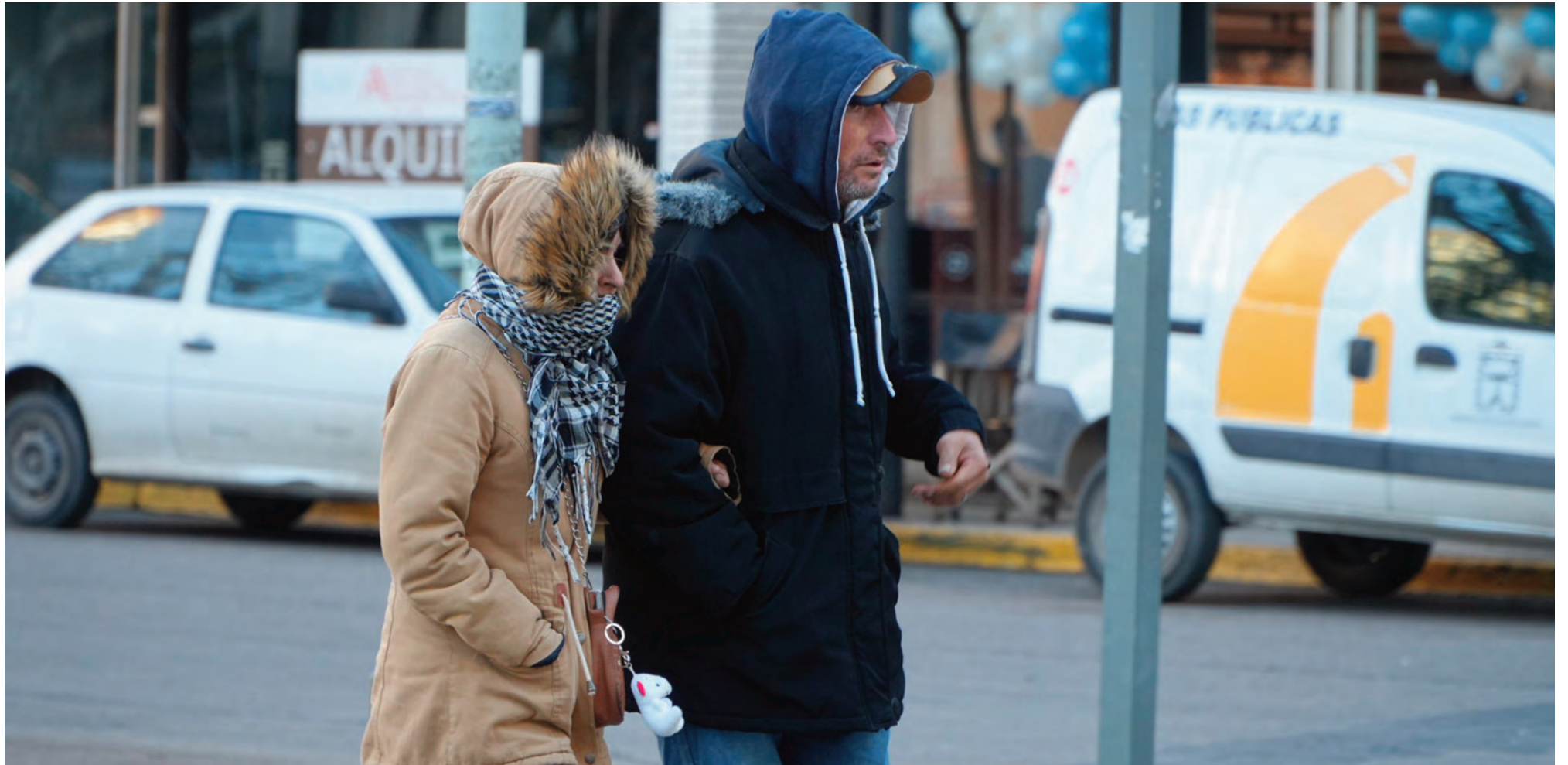
Río Cuarto ya viene con días fríos, pero la situación se agravará a partir de hoy.

Ingresará desde hoy una masa de aire frío de origen polar. Las bajas temperaturas persistirán durante una semana. Además, las máximas no alcanzarían los 10 grados durante varios días. Advertencias y recomendaciones