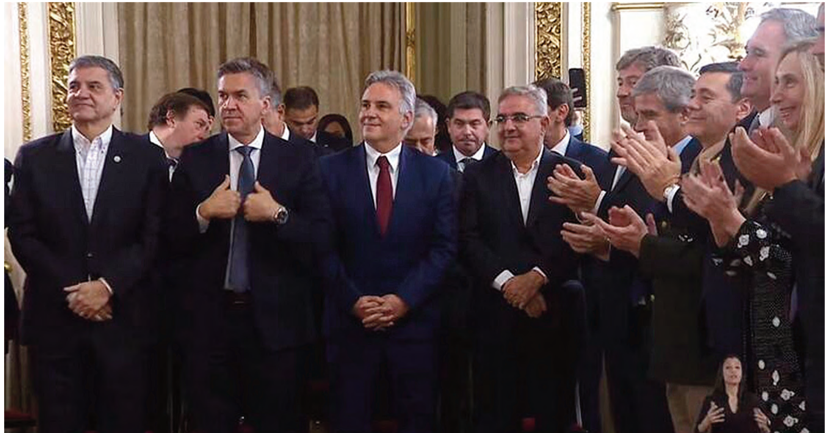
El gobernador Llaryora, ayer, durante la asunción en la Casa Rosada.

Ese cambio en el poder mileísta, esa nueva construcción en el núcleo de poder, donde Santilli ocupará el cargo formal con mayor peso político, es además indicio,