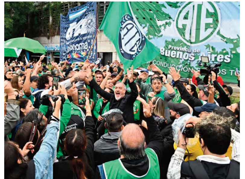
Manifestación de ATE frente a la Cnea.