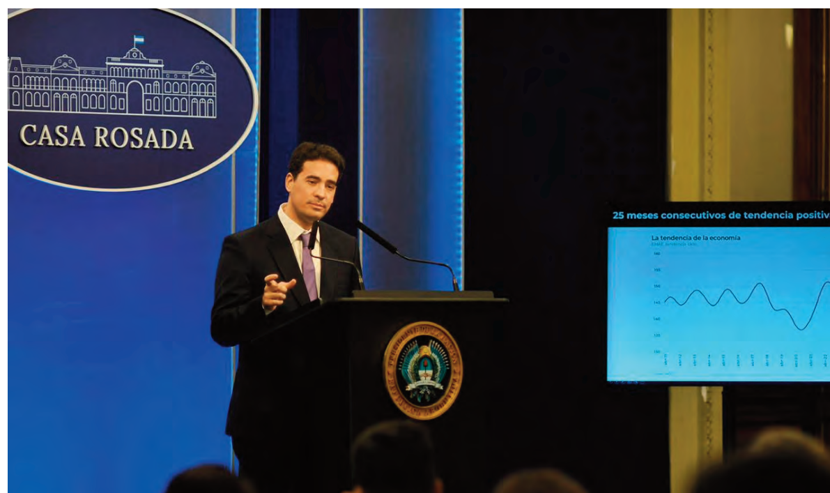
El vocero dejó sus primeras impresiones en su comparecencia ante los periodistas.