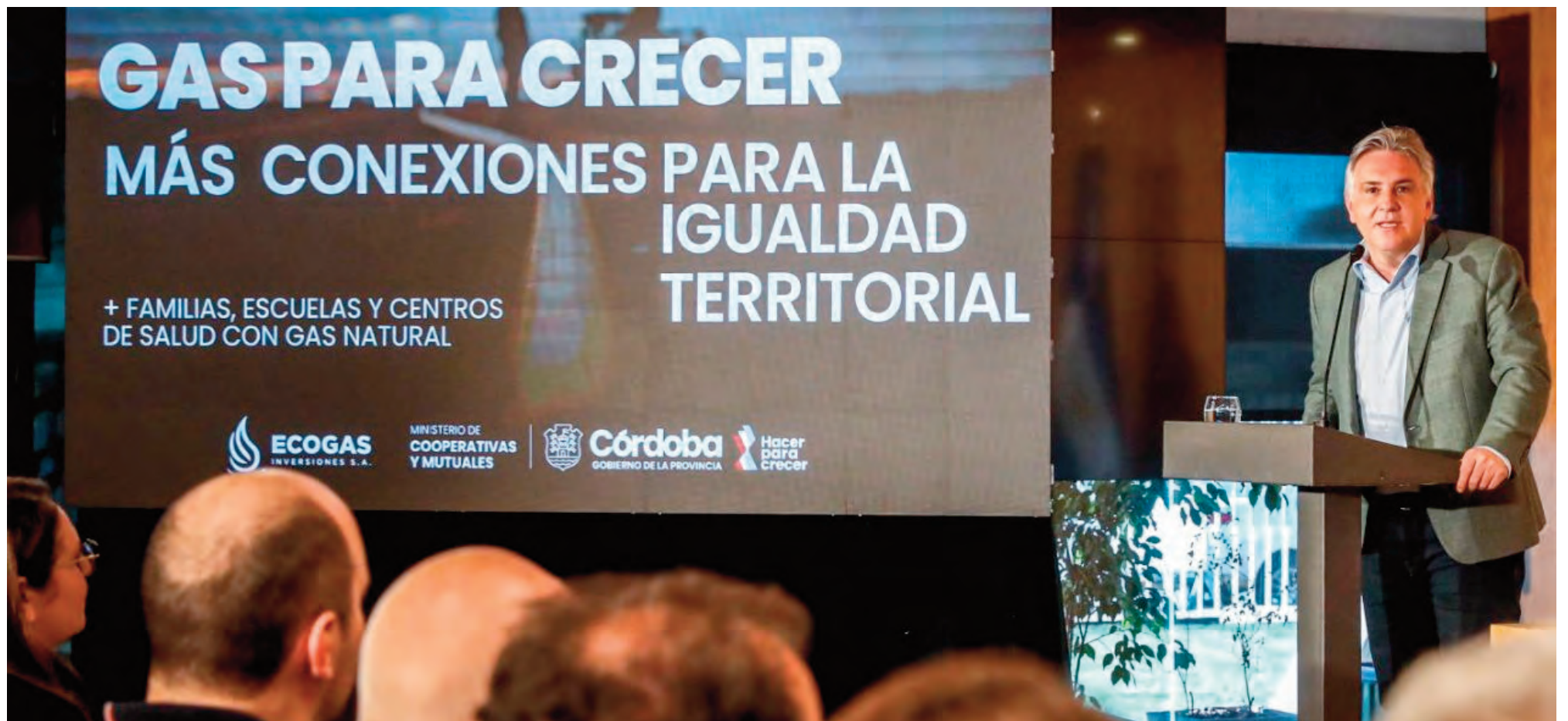
Llaryora lanza el plan de conexión al gas natural.