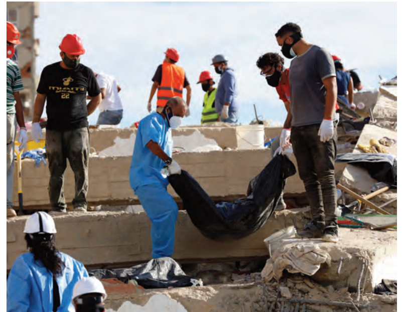
Socorristas retiran un cadáver en La Guaira.

“Se ha discutido mucho en el último tiempo el tema del financiamiento universitario, como si ese fuera el único tema en educación. A nosotros nos preocupa el ausentismo de los alumnos, el abandono de los alumnos en las escuelas y colegios, y nos preocupa la calidad educativa. Muchos chicos llegan a la universidad y no logran pasar la barrera del primer año, no logran aprobar materias, y eso después determina la deserción que vemos en altos grados en las universidades públicas y también privadas”, opinó.