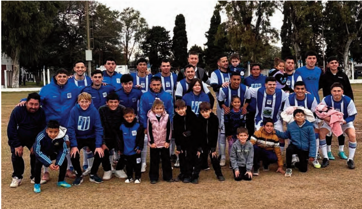
El plantel de Unión Social de Alto Alegre que se presentará esta noche en la Plaza para medirse en el clásico ante Deportivo Silvio Pellico. Viene de eliminar a Juventud.

El clásico del Norte de la Liga se disputa en Plaza Ocampo desde las 22.30. La Policía no otorgó seguridad en la cancha del "canario", y juegan en Villa María