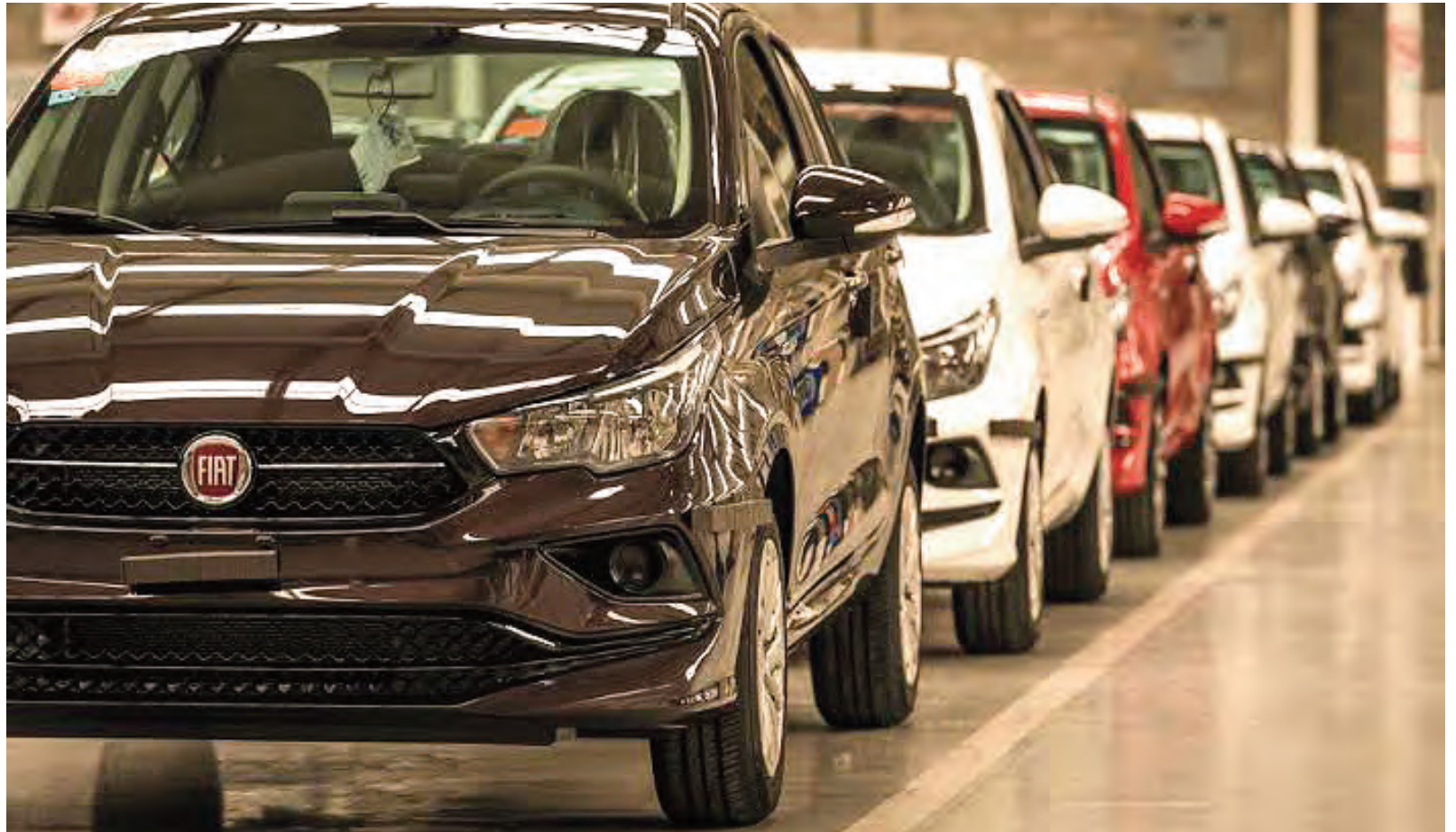
Las concesionarias confían en que el segundo semestre del año será mejor que el primero.

Y agregó: "Los clientes siguen analizando mucho su decisión y esperando que bajen las tasas o haya nuevas opciones para acceder a los vehículos, mientras que