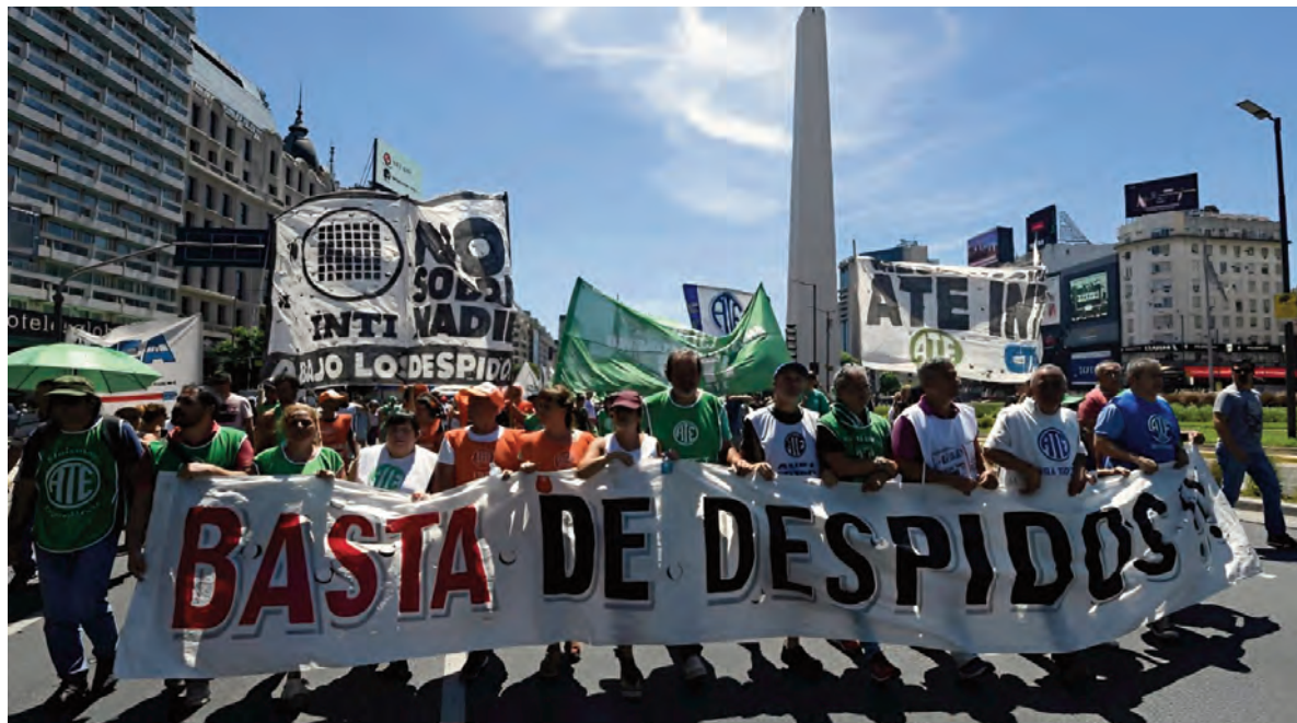
El Correo Argentino es el ente estatal que sufrió más cesantías: 5.449.

El caso más significativo es el del Correo Argentino, que encabeza el listado con 5.449 despedidos.