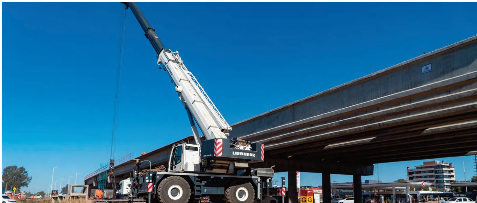
Construyen uno de los altos niveles de la Circunvalación.

PISCIS 22/02 - 21/03 Trabajo y negocios: un nuevo proyecto parecerá factible pero será útil analizar algunos detalles. Amor: la calidez podría enfriarse por malentendidos pero pronto recuperará la armonía.