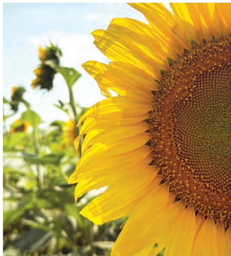
El girasol crece cada vez más en extensiones de cultivos a nivel nacional.

El girasol, caracterizado por su capacidad de adaptarse a ambientes restrictivos tanto de suelo como de clima, comenzó a ganar terreno en zonas donde otros cultivos presentan mayores limitaciones. En el este cordobés, por ejemplo, se posiciona como alternativa frente a la soja en lotes de menor potencial, mientras que en otras regiones aparece como reemplazo del maíz tardío, afectado en