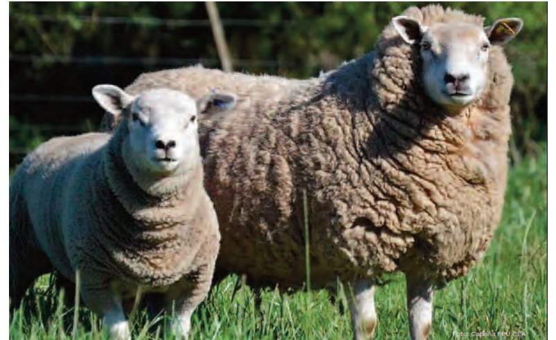
La cría de cordero pesado permite sostener la oferta para consumo durante el año.

El modelo, además, mejora la eficiencia productiva al optimizar la relación músculo-hueso y permitir un uso más preciso de la genética