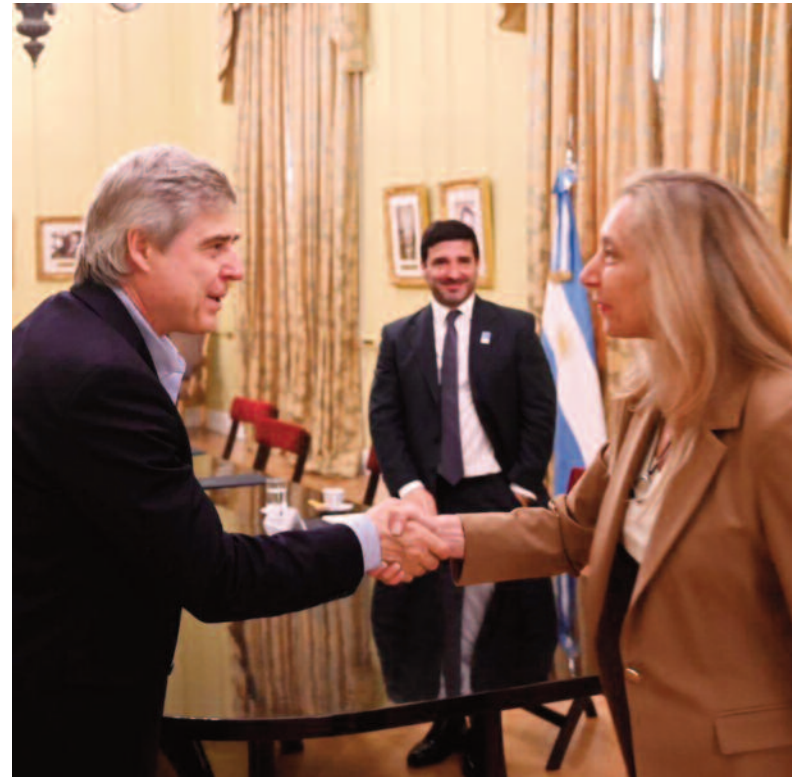
La secretaria general de la Presidencia, Karina Milei, recibió a los referentes de la carne.