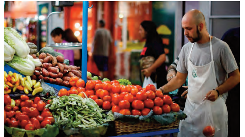
La inflación de enero habría estado impulsada por las subas en verduras.

Al analizar la dinámica alcista de los últimos meses, explicaron que “la leve aceleración inflacionaria que hemos visto es el reflejo de la baja de la demanda de pesos por la creciente incertidumbre electo-