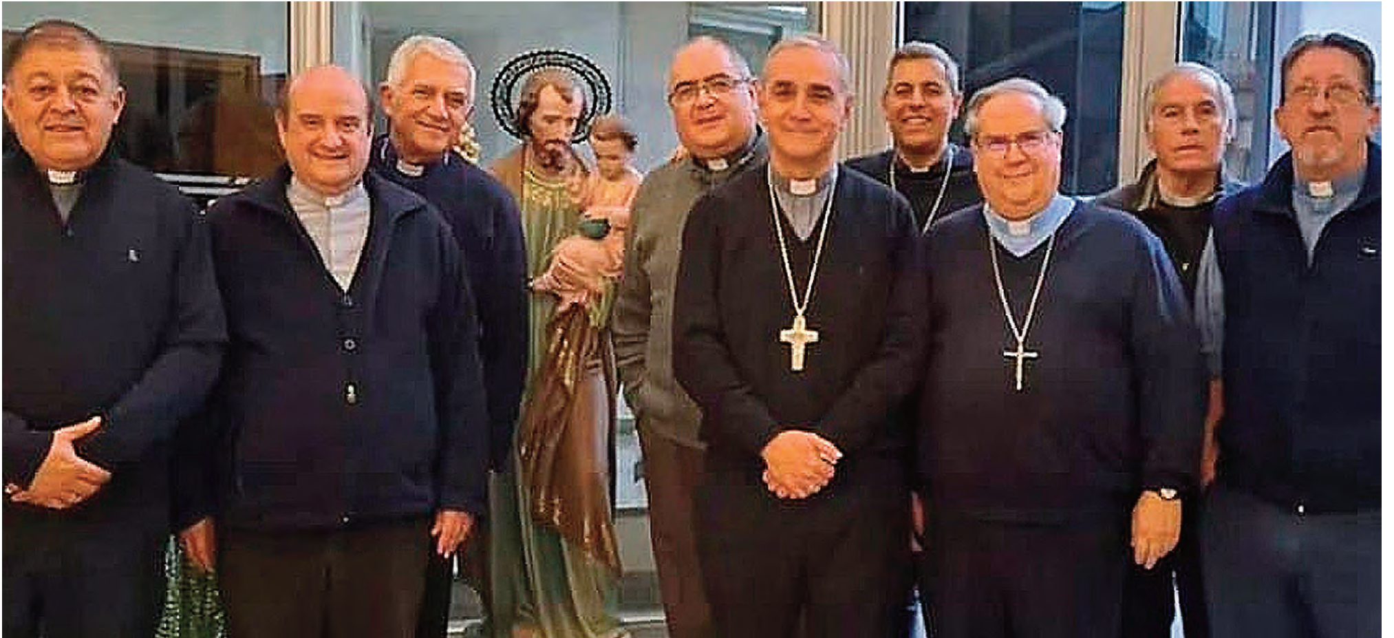
La Iglesia de Córdoba, en contra de la baja de la edad de imputabilidad.