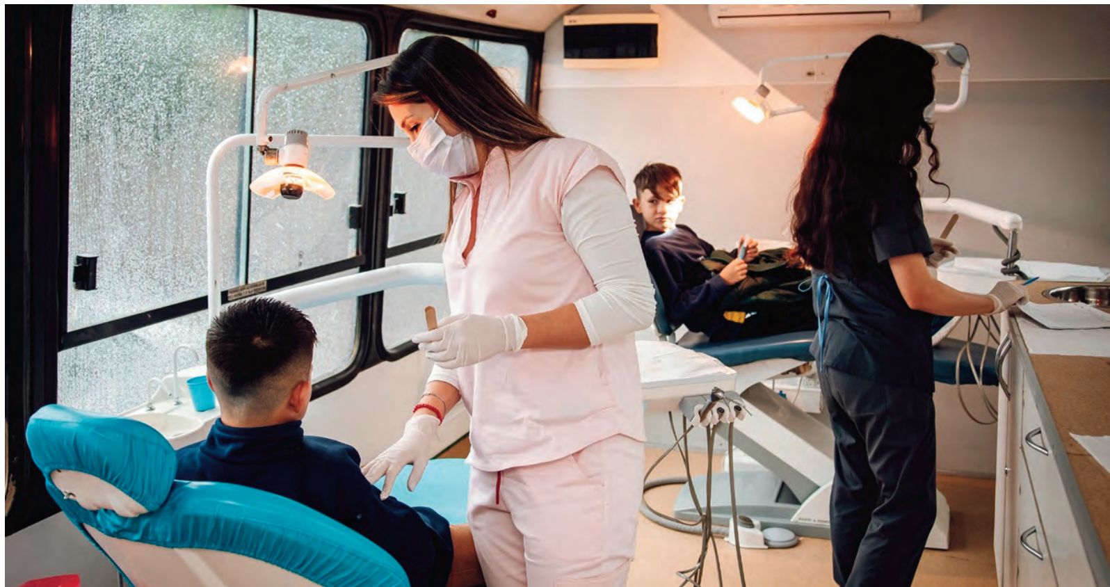
En el servicio odontológico, el 65 por ciento de los pacientes no contaban con obra social.

Al mismo tiempo, se realizaron 14.261 Certificados Únicos de