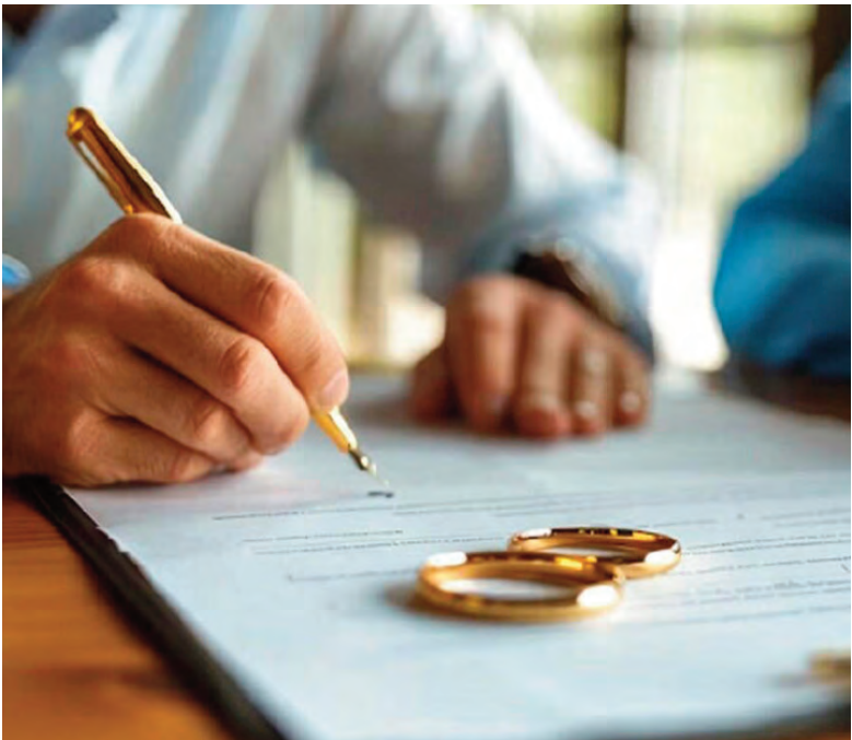
La duración promedio de los matrimonios es de 14 años.

libro “Investigaciones aplicadas en la justicia de Córdoba. Edición especial 20 años 2005-2025”, publicado por el Centro de Perfeccionamiento Ricardo C. Núñez- también destacó que en el 10% de las causas analizadas, las partes tenían entre 61 y 70 años de edad. Incluso, se observaron algunos casos en los cuales los matrimonios se habían extendido por más de 30 años. “De la totalidad de datos recabados y analizados, es posible mencionar que la duración promedio de los matrimonios fue de 14 años y que los procesos de divorcio se llevaron a cabo en la etapa de madurez de la vida de los cónyuges”, señala el informe. Además, los investigadores indicaron que son mayoritariamente las mujeres quienes inician los procesos de divorcio en matrimonios que tienen entre 20 y 30 años de