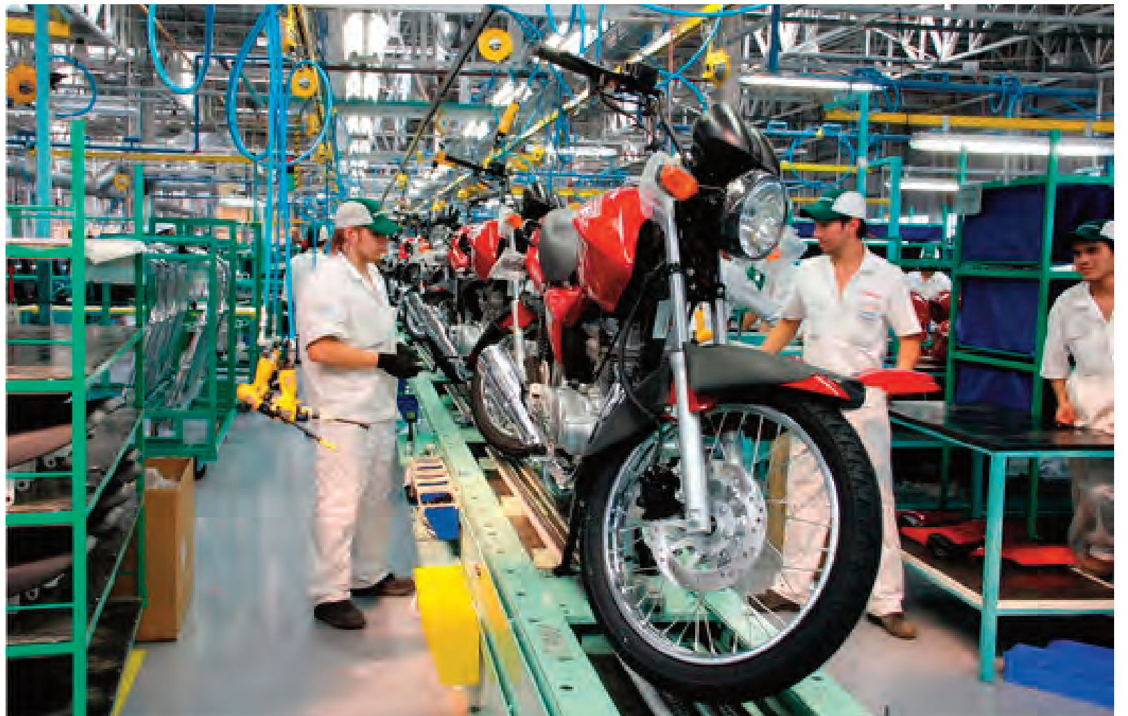
Las ventas de motos mantienen un buen ritmo en el país, con algunas particularidades sobre las provincias más fuertes detrás del podio: Tucumán, Chaco y Salta.

En cuanto a la participación, se observan cambios con respecto a diciembre en los primeros puestos, Honda siguió liderando el mercado con 13.692 unidades, seguida por Gilera que retoma la segunda posición, con 8.743, dejando, con 8.543, a Motomel, en el tercer es-