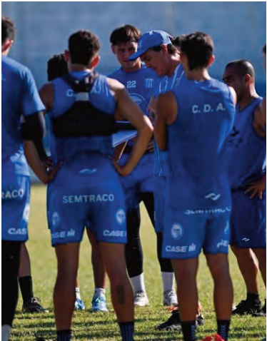
Argentino va por la hazaña.

Talleres, por su parte, se cruza ante Argentino de Merlo