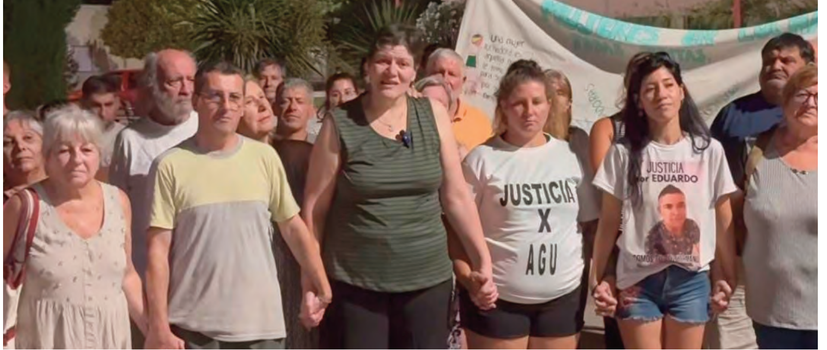
Una nueva movilización se realizó este lunes en La Playosa para pedir Justicia por el caso del exbombero acusado de abuso.