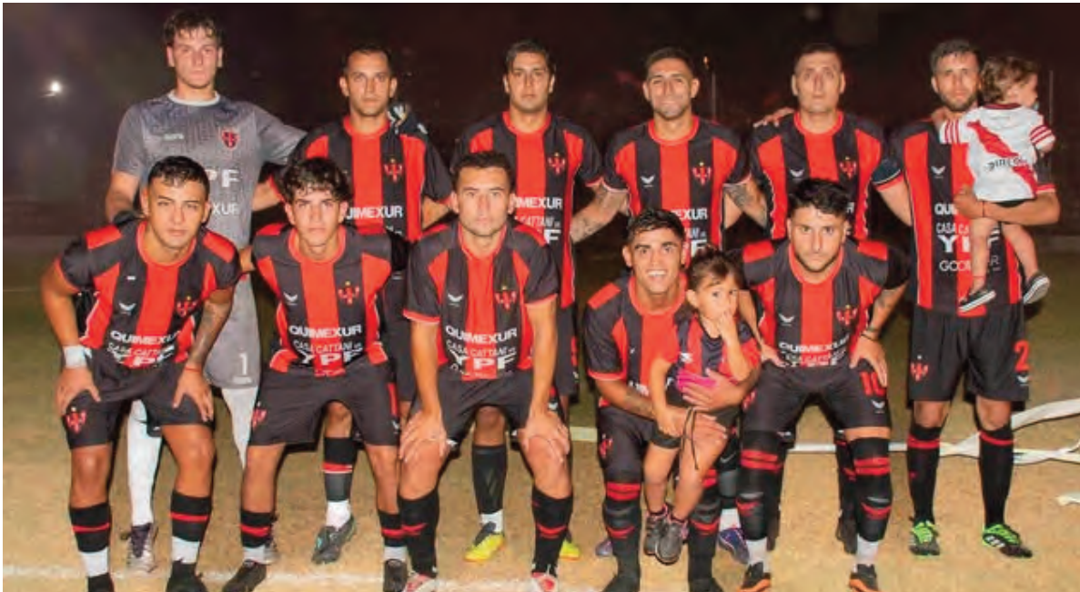
Central Argentino de La Carlota recibe hoy desde las 21.30 a Atlético Adelia María en el inicio de la segunda rueda del provincial.

Asociacion Española (V. María) - Almafuerte (Las Varillas) Árbitro: Gastón Ambrosino (Liga Cordobesa). Hora de inicio: 21.30 Subzona B Ilusión del Norte (S. Elcano) - Arg. Peñarol (Córdoba) Árbitro: Azarías González (Liga General Roca). Inicio: 21.30 Interzonal: Sportivo Sacanta (Sacanta) - Progreso (Noetinger) Árbitro: Gustavo Arciénaga (Liga de Canals). Hora de inicio: 21.30 Zona 2 Central Norte (Cruz del Eje) - San Brochero (V. Dolores) Árbitro: Franco Barrios (Liga Bellvillense). Inicio: 21.30 Comercio (V. Dolores) - Tráfico (Cruz del Eje)