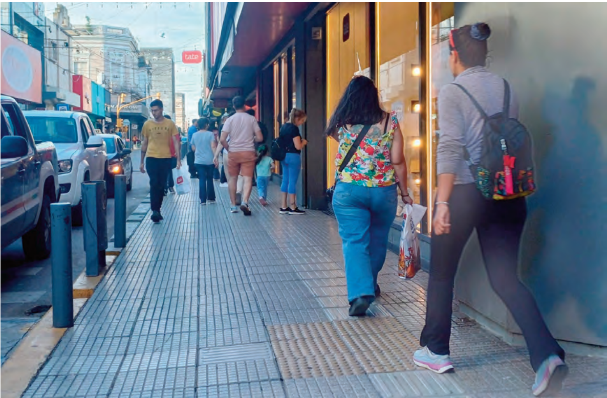
La actividad comercial tuvo un mes negativo en diciembre.

Según el último informe de recaudación de la Secretaría de Economía, la contribución que incide sobre el Comercio, la Industria y los Servicios de la ciudad, que marca el ritmo de la actividad económica, tuvo un aumento en términos nominales de apenas el 19 por ciento en diciembre. Si se compara ese número con el 31,5 por ciento de inflación que se acumuló el año pasado, la caída en términos reales fue importante. Lo que facturaron los comercios y las empresas de Río Cuarto ni siquiera alcanzó a compensar el efecto de