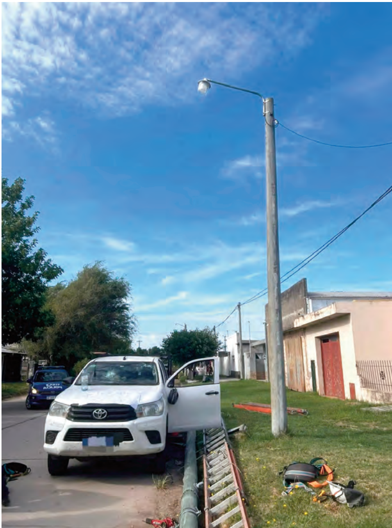
El accidente laboral se registró en Wilde y Pellegrini de Laboulaye.

La víctima trabajaba para una empresa tercerizada dedicada a telecomunicaciones y videovigilancia.