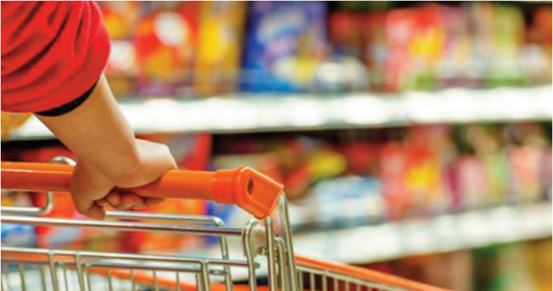
El consumo volvió a caer en Córdoba.

tarjetas de crédito, al fiado o con dinero prestado, mientras que sólo el 10,9% pudo afrontar estos gastos sin recurrir a un financiamiento. “Estos indicadores vuelven a evidenciar que la seguridad alimentaria se encuentra crecientemente sostenida sobre mecanismos de endeudamiento y asistencia pública, configurando un escenario social de alta vulnerabilidad estructural”, indica el estudio. “Durante enero, la actividad del comercio minorista de ventas de alimentos continuó exhibiendo signos contractivos. Las ventas en volumen registraron una caída del 8,2%, profundizando la tendencia recesiva observada durante el último trimestre de 2025”, agrega. “La coexistencia de inflación en niveles persistentes, recomposición tarifaria, caída del poder adquisitivo y contracción del consumo configuran un escenario