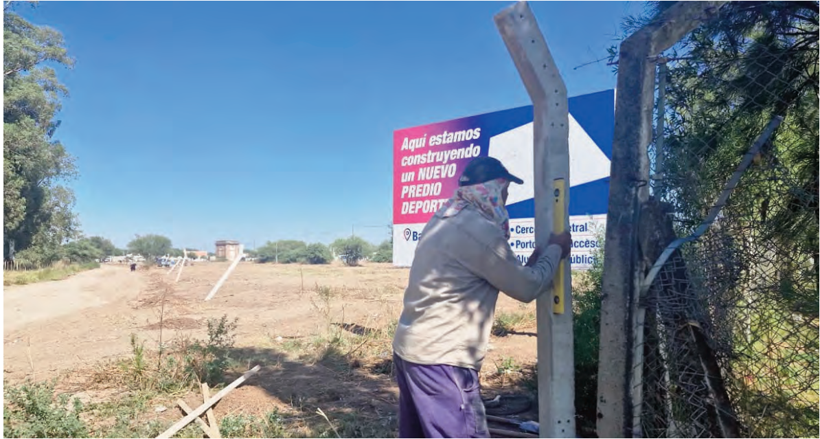
Operarios avanzan con las tareas de cerramiento del predio de cinco hectáreas que gozarán los clubes El Tallerito, Alianza, Unión Central y CIEF.