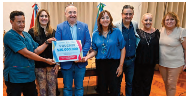
Los fondos permitirán avanzar en la adquisición de equipamiento en tres cooperativas.