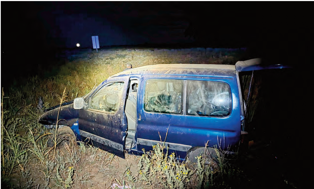
Se investigan las causas que derivaron en el despiste y posterior vuelco del utilitario.

Dos jóvenes fueron trasladados al hospital de Vicuña Mackenna. Los otros tres fueron asistidos en el lugar del siniestro vial