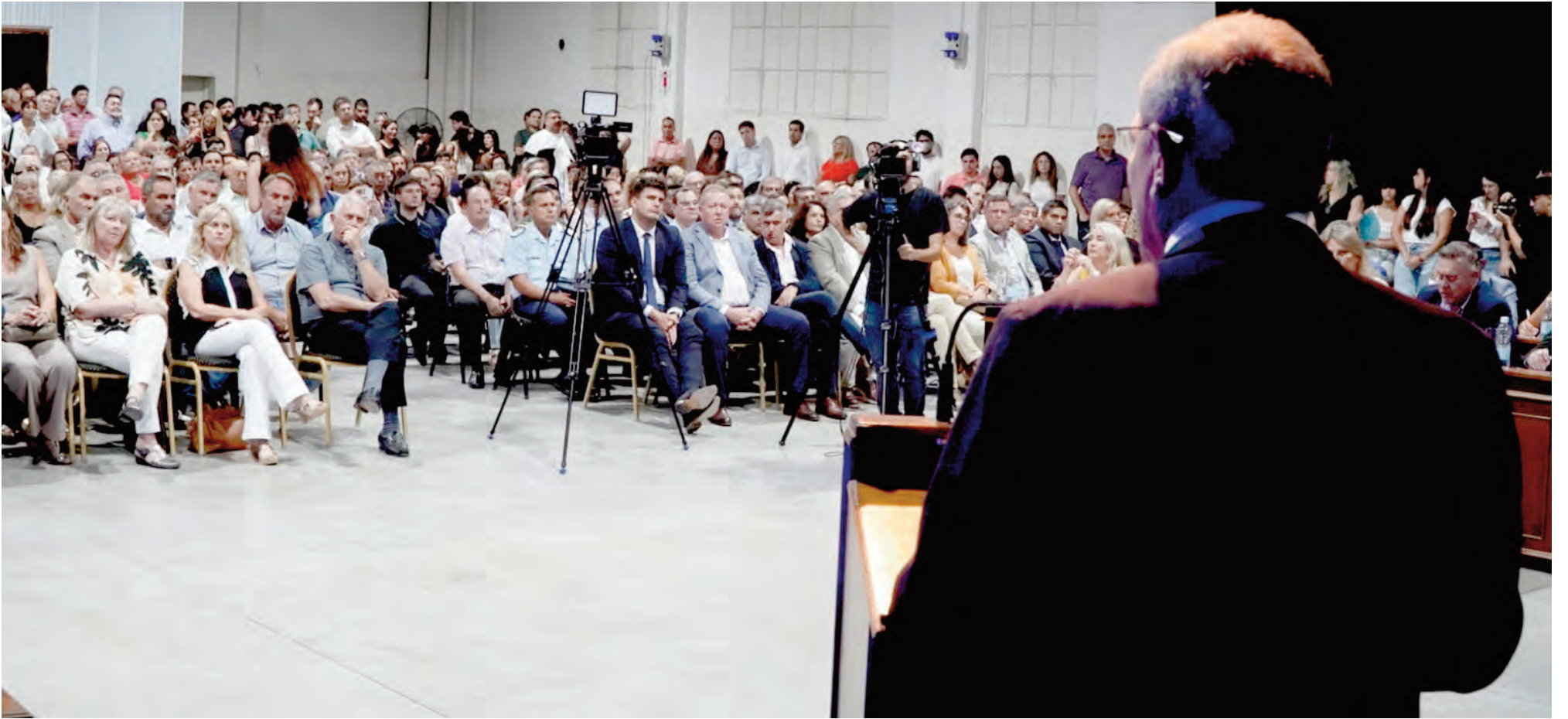
De Rivas habla y sus funcionarios lo escuchan.