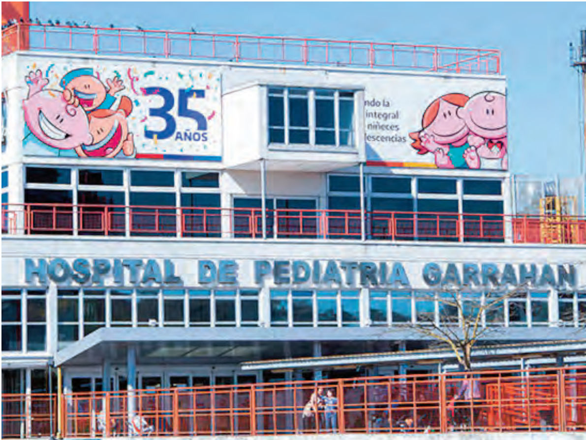
El Gobierno ordenó la cesantía de once empleados del Hospital Garrahan tras la toma de oficinas.

El resto de los empleados sumariados recibirá sanciones menores, de acuerdo con la evaluación individual de las conductas durante el episodio. El Hospital Ga-