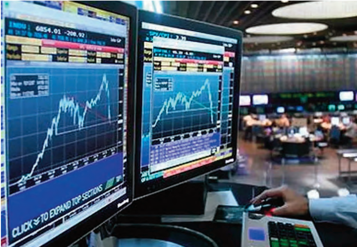
Las acciones argentinas se derrumbaron en Wall Street.

Entre los bonos y el panorama bajista, los Bonares caen en totali-