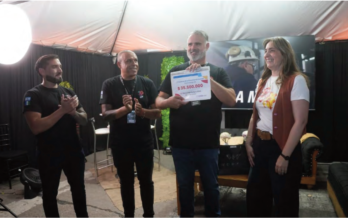
El aporte económico estará destinado a solventar gastos de armado y logística tanto del Recorrido Peñero como del Festival de Peñas.

Además, el año pasado el Recorrido Peñero fue declarado de in-