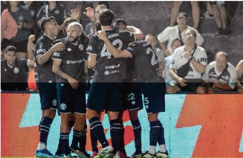
Independiente Rivadavia festeja el primer gol en el partido ante Sarmiento.

Nota: Los primeros ocho primeros clasifican para los play off.