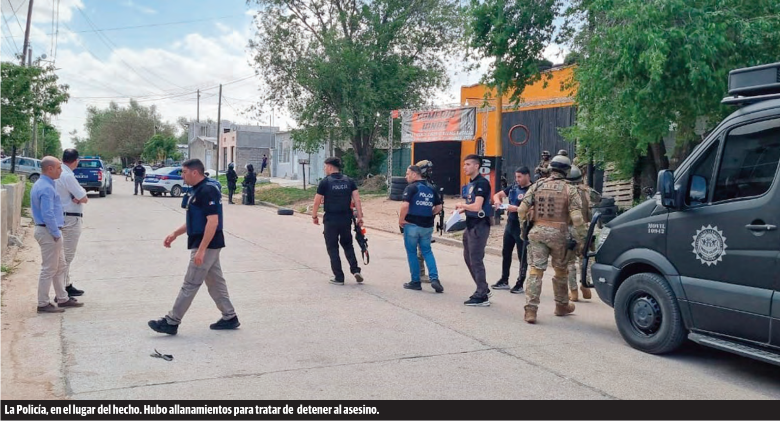
La Policía, en el lugar del hecho. Hubo allanamientos para tratar de detener al asesino.

CAMPAÑA Recta final: a dos semanas de la elección, barrios, redes y aparato Cara a cara con los vecinos, entrevistas en medios, viralización de cómo votar, capacitación de fiscales, armado de la movilización y actos de cierre son el combo que las 18 fuerzas pondrán en marcha RÍO CUARTO | 10-11