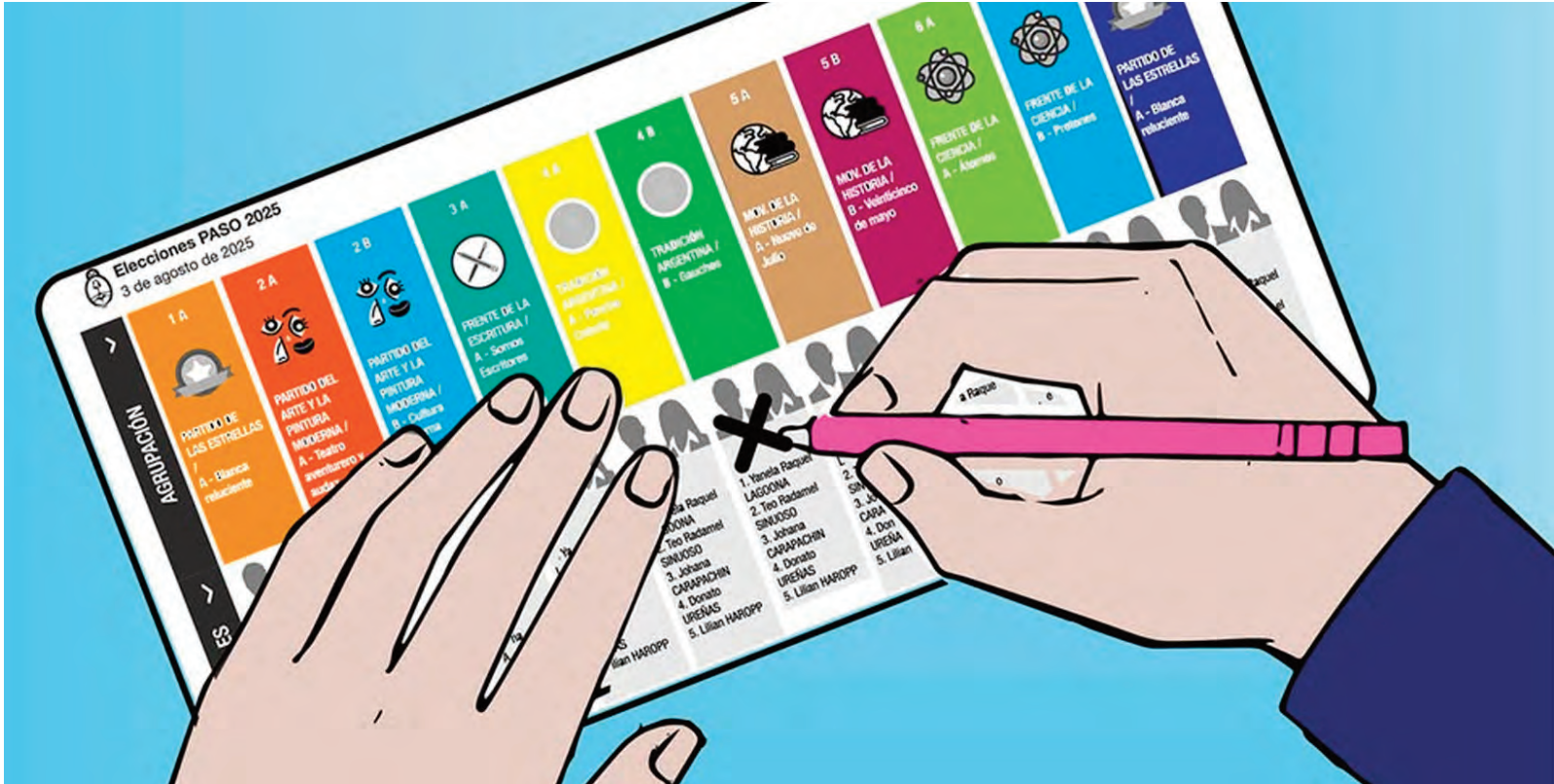
En el cuarto oscuro estarán las BUP.