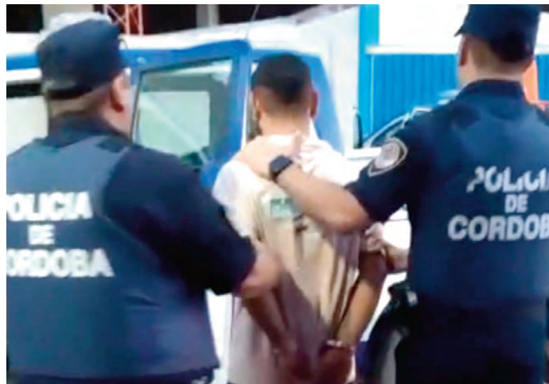
El joven fue trasladado a sede policial.

El Ministerio Público Fiscal dis- puso la detención del hombre.