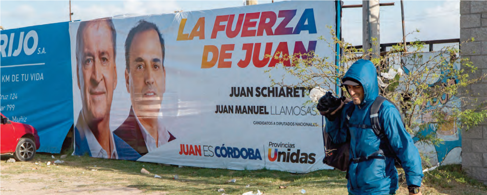
Los afiches y gigantografías ya visten las principales esquinas.