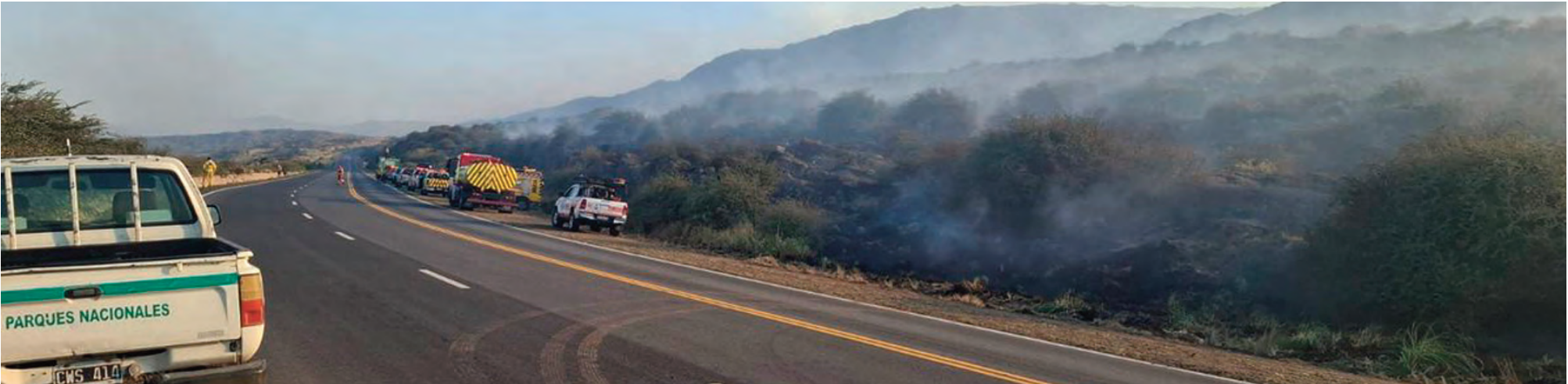
A pesar del trabajo constante de los bomberos, aún no pudieron contenerse las llamas.