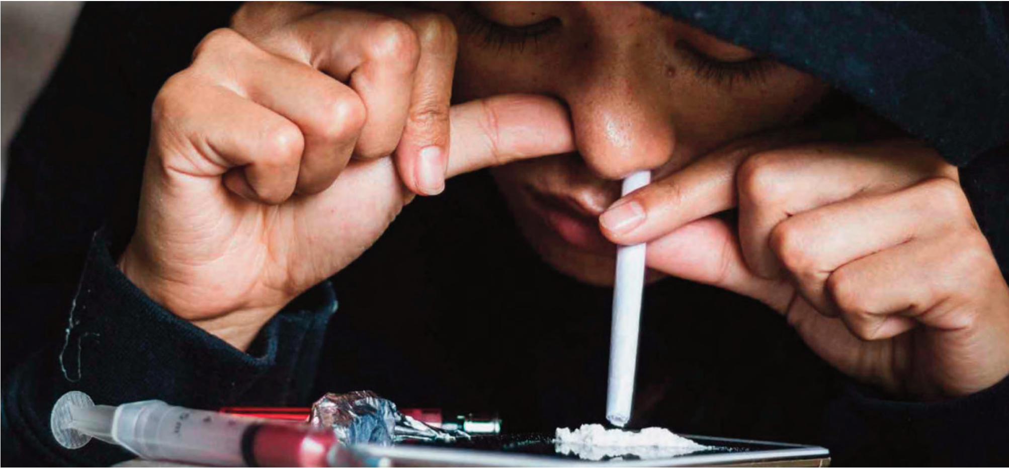
Crece la preocupación por la vinculación entre delitos y drogas.