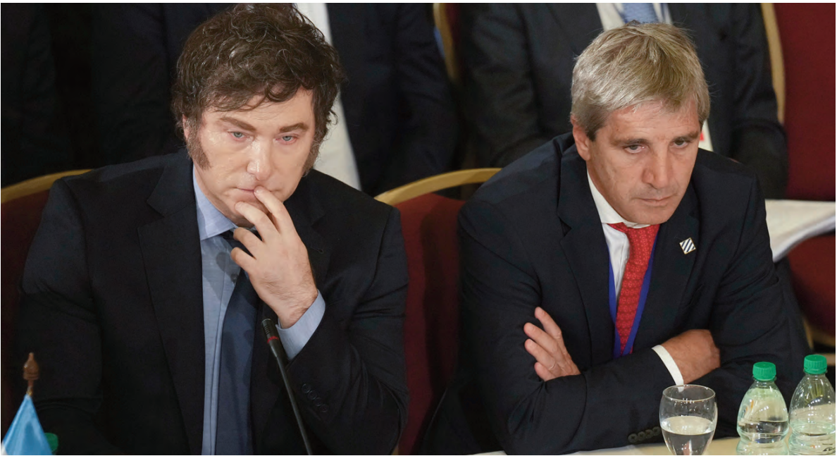
El Gobierno también recibió desembolsos del Fondo Monetario.

Desde mediados de abril de 2025, el tipo de cambio real bilateral oficial peso/US$ se depreció casi 20%, el contado con liquidación 28% y el oficial multilateral 24%.