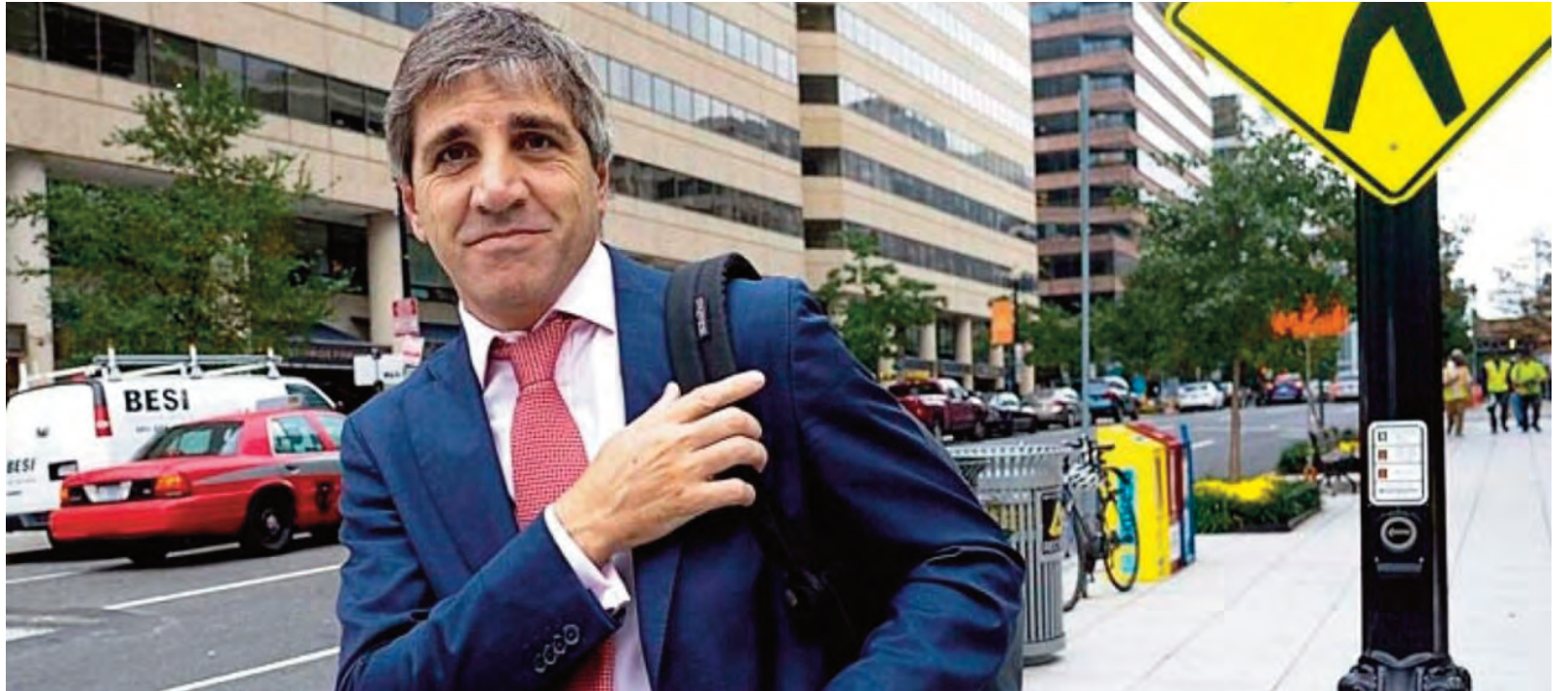
Caputo se trajo los dólares de Estados Unidos para salvar el plan económico.

El secretario del Tesoro señaló, además, que el esquema de bandas es adecuado y diagnosticó que el peso está subvaluado. Del acuerdo, que se anunciaría el martes, se sabe poco y nada: se dijo que habrá un swap de US$ 20.000 millones, pero no se detallaron las condiciones ni si las operatorias de compra-venta de moneda se repetirán en el futuro o si fue una excepción. Estados Unidos actuó pero en Argentina, excepto los negociadores, nadie sabía nada. Todo el mundo se enteró por Bessent. La incertidumbre y la indefinición además habilita algunas preguntas: ¿si el secretario del Tesoro considera que el peso está subvaluado, seguirá tomando acciones para revalorizarlo? ¿Cuán injerencia tendrá en la política cambiaria del país? El tipo de cambio define el grado de competitividad de los productos argentinos en el mundo, por ejemplo, de la soja, un mercado en el que Argentina compete con Estados Unidos. ¿Bessent llevará el peso a un nivel que sea conveniente para su país o para el de su socio político, cuando tenga que elegir ante la presión de los farmers? Tal vez sean inquietudes infundadas pero que seguirán flotando en el aire mientras la Casa Rosada no despeje las dudas sobre cuál es la letra chica del acuerdo