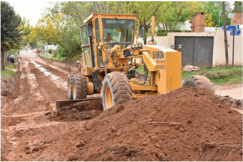
Las obras están en marcha en tres frentes diferentes.

Se trata de 6.000 m² de superficie con la construcción de 650 metros lineales de pavimento asfáltico en sectores clave. Incluyó la reconstrucción de bocacalles en Pucará y Carmen García y en Pucará y Presidente Perón, un nuevo badén en D. R. del Llano y Carmen García, además de otra rotonda en 2 de Abril y D. R. del Llano. Las intervenciones aportarán una mejor conectividad, al favorecer la circulación interna del barrio y la vinculación con arterias principales. También refuerza la seguridad vial con cruces más visibles, badenes en buen estado y calzadas regulares que reducen riesgos. Al mismo tiempo, mejora la calidad de vida de los vecinos al eliminar polvo y barro, agilizar los traslados y revalorizar la infraes-