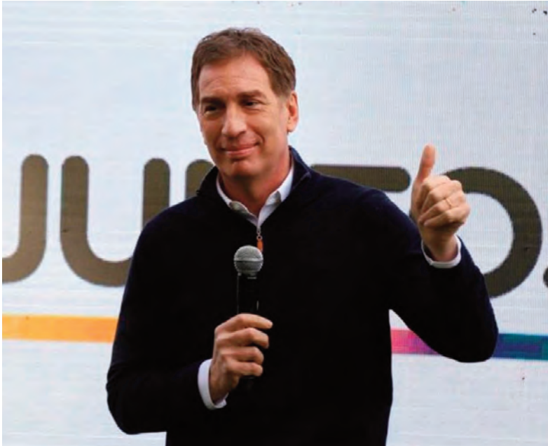
Santilli debe encabezar la lista de LLA, señaló la Cámara.

En el fallo que ungió a Santilli, la Cámara planteó que Ramos Padilla “desatendió la jurisprudencia” y “tergiversó la aplicación de un precedente”, en relación con lo que se definió en un reemplazo que hubo que hacer en otra elección, pero en ese caso en la categoría de senadores.