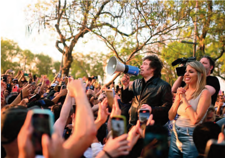
Milei habla en la costanera de la capital correntina. A su lado, Virginia Gallardo.

cio. En su breve discurso, que no superó el minuto, Milei insistió en su mensaje de perseverancia ante las dificultades del proceso económico y político. “Nos encontramos en una disyuntiva: avanzamos hacia las ideas de la libertad y la prosperidad o volvemos al pasado kirchnerista. No aflojen, esta vez el esfuerzo vale la pena, porque la libertad avanza o la Argentina retrocede”, expresó ante los aplausos de la multitud, antes de cerrar con su tradicional “¡Viva la libertad, ca- rajo!”. Milei también dedicó palabras de respaldo a los referentes locales de su espacio. “Tienen a un gobernador como Zdero, que trabaja fuerte por todos los chaqueños, y cuando Silvana esté en el Senado va a luchar como un león porque defiende la libertad”, afirmó. A su lado, escuchaban los candidatos a senadores Juan Cruz Godoy y Sil-