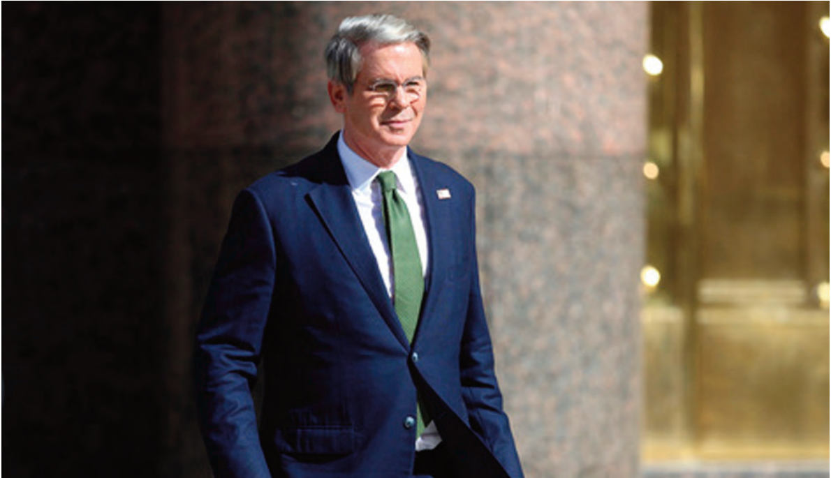
La embajada china acusó a Bessent de “intervencionismo” en los asuntos internos de otras naciones.

Las declaraciones de Bessent no pasaron inadvertidas en la Argentina. A pesar de que Milei tiene un nexo profundo con Trump y su administración, y a que desde que era candidato haya asegurado que