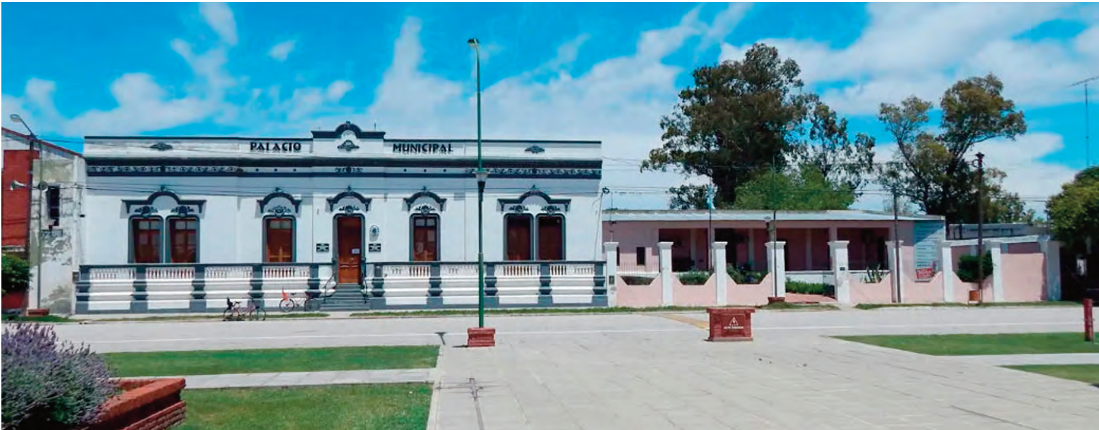
Reducción vota hoy intendente.

PISCIS 22/02 - 21/03 Amor: un entredicho podría hacerle perder de vista lo esencial de la pareja, pero su corazón fluirá. Salud: será necesario un análisis. Sorpresa: nueva relación.