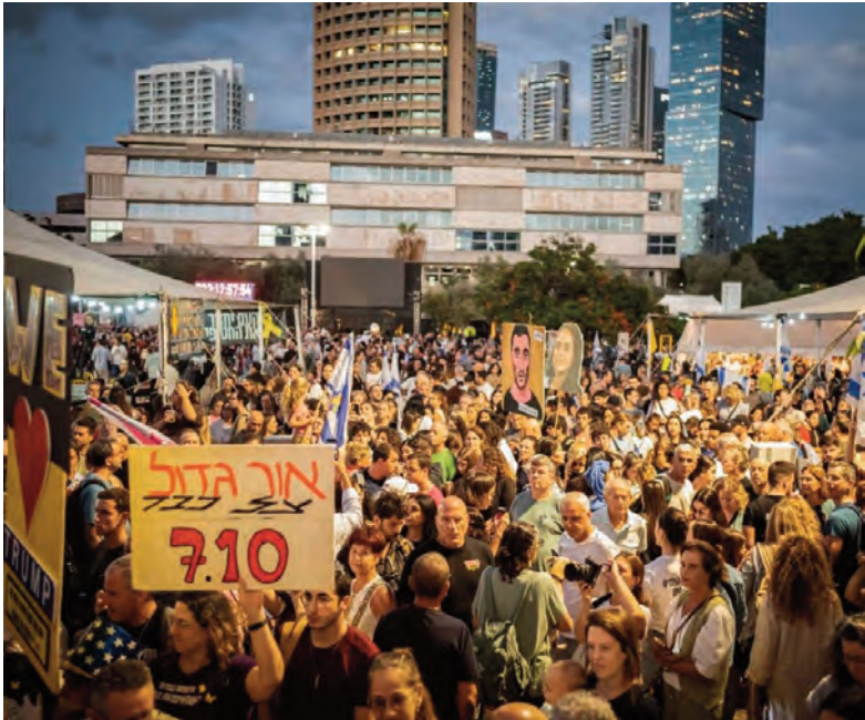
Familiares de los rehenes celebraron en Tel Aviv la próxima liberación.