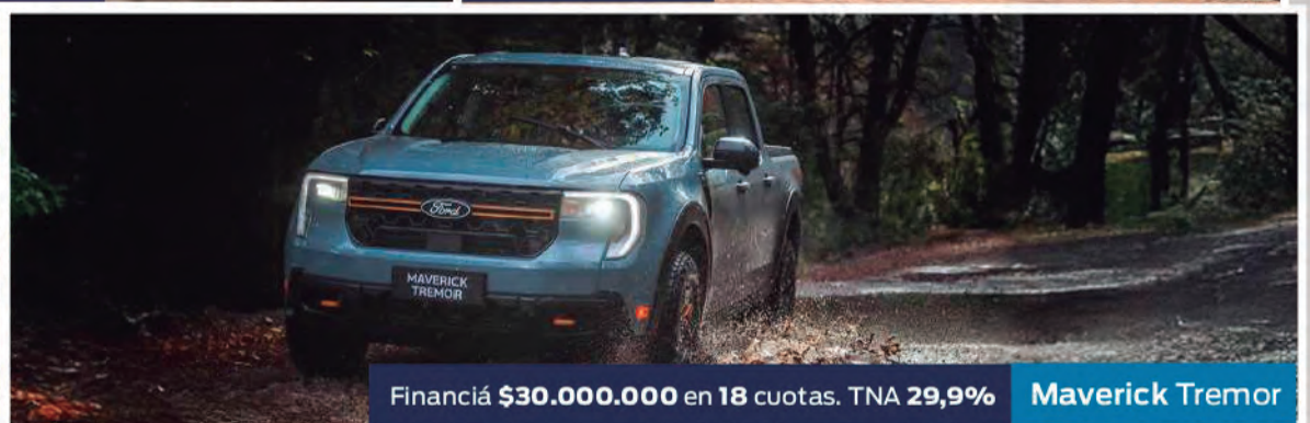
Financió $30.000.000 en 18 cuotas. TNA 29,9% Maverick Tremor