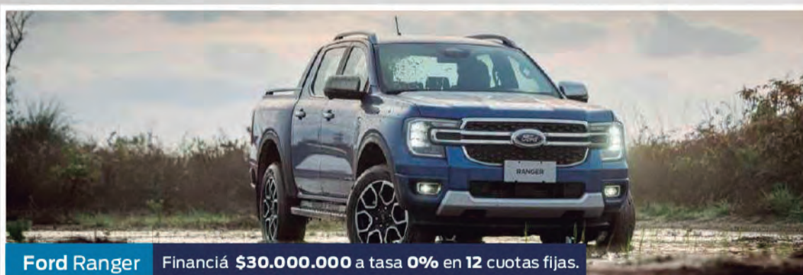
Ford Ranger Financió $30.000.000 a tasa 0% en 12 cuotas fijas.