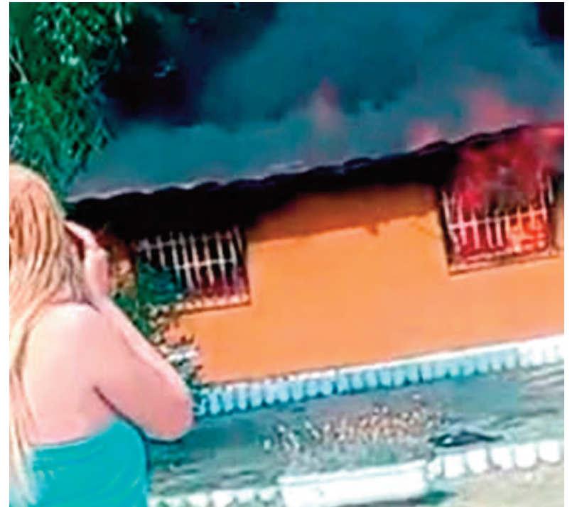
Las pérdidas fueron totales por el fuego. Las niñas eran de Uruguay.

El espacio incendiado, que tenía techos de chapa, quedó completamente consumido por la acción del fuego.