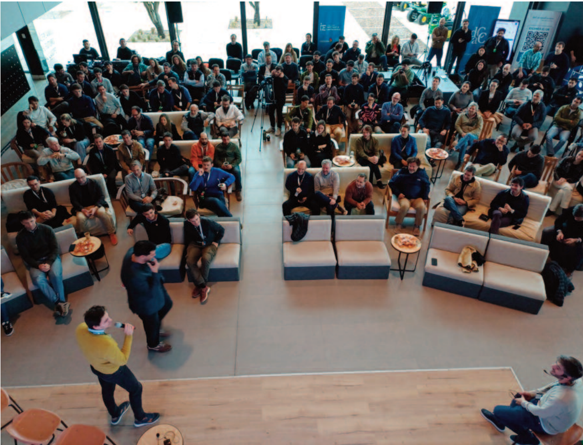
Unos 200 productores agropecuarios y empresarios agroindustriales formaron parte de Sembrando Innovación.

Más de 200 personas se reunieron ayer en Río Cuarto para ser parte de una jornada repleta de experiencias y conocimiento sobre el desarrollo de nuevas oportunidades y servicios vinculados al campo