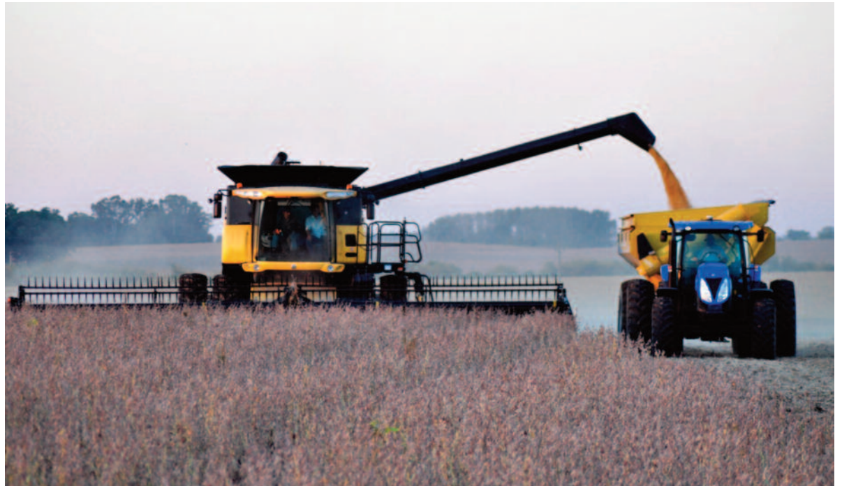
La soja es la principal aportante de recursos en la provincia.

En la provincia, el mayor aporte lo realizarían la soja y el maíz con US$ 5.463 millones y US$ 3.560 millones respectivamente. En menor proporción participaría el maní con US$ 885, el trigo con US$ 823, el girasol con US$ 236 y el sorgo con US$ 118.