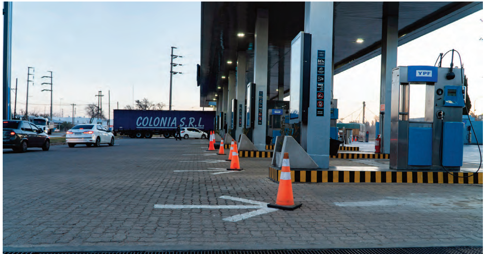
Las estaciones de servicios continuaron con el mismo panorama que comenzó el miércoles.

Según estimaciones del Enargas difundidas en las últimas horas, la demanda superó los 100 millones