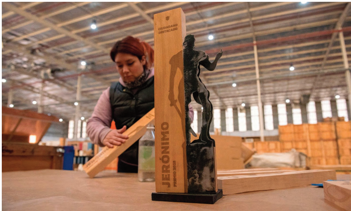
La escultura, más esbelta que en años anteriores, realizada con materiales recuperados.

apellido: aquellas personas y organizaciones que contribuyen al desarrollo de Córdoba Capital y destacan por su compromiso social y humanitario en materia cultural,