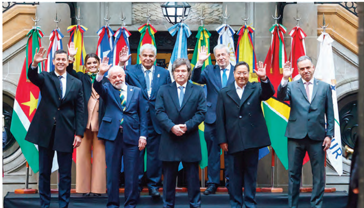
La tradicional foto de la reunión de presidentes.

“Emprenderemos el camino de la libertad, y lo haremos acompañados o solos, porque -como ya he dicho- Argentina no puede esperar. Necesitamos más comercio, más actividad económica, más inversión y más trabajo, de manera urgente. Y por eso necesitamos