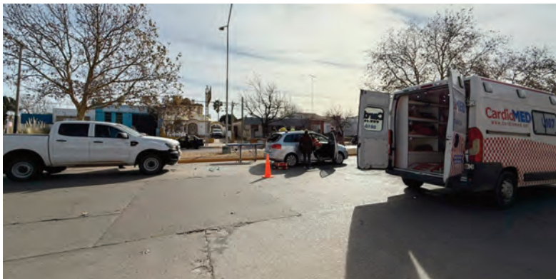
Una camioneta y dos autos involucrados en el choque en cadena.