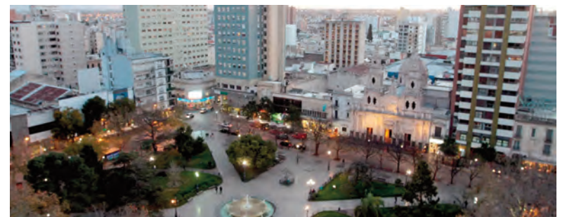
Los servicios son los que más generan empleo en la ciudad.

Por último, se advierte sobre la necesidad de anticipar los efectos de la automatización laboral.