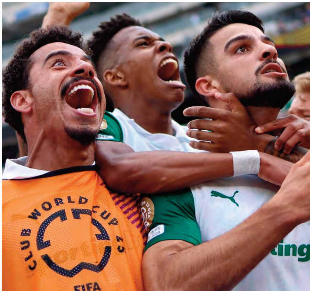
Palmeiras intentará dejar en el camino a uno de los clubes europeos más fuertes que sigue en el Mundial: El Chelsea.

El Palmeiras, que está teniendo un gran año, se clasificó a esta instancia luego de avanzar como primero en su grupo que compartió con el Inter Miami de Estados Unidos, el Porto de Portugal y el Al Ahly de Egipto, y de eliminar en los octavos de final al Botafogo, vigente campeón de América, por 1-0.