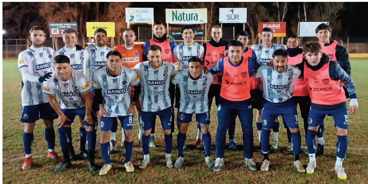
Los 18 elegidos para el último partido. Promesas de excelentes jugadores y jugadores con extensa trayectoria en nuestra Liga.

La frase de la historieta “El Eternauta” bien puede ser presente con el rendimiento del seleccionado de primera división de la Liga Regional de Fútbol de Río Cuarto, que en la noche del miércoles obtuvo el objetivo de clasificarse a los play off en la región Centro