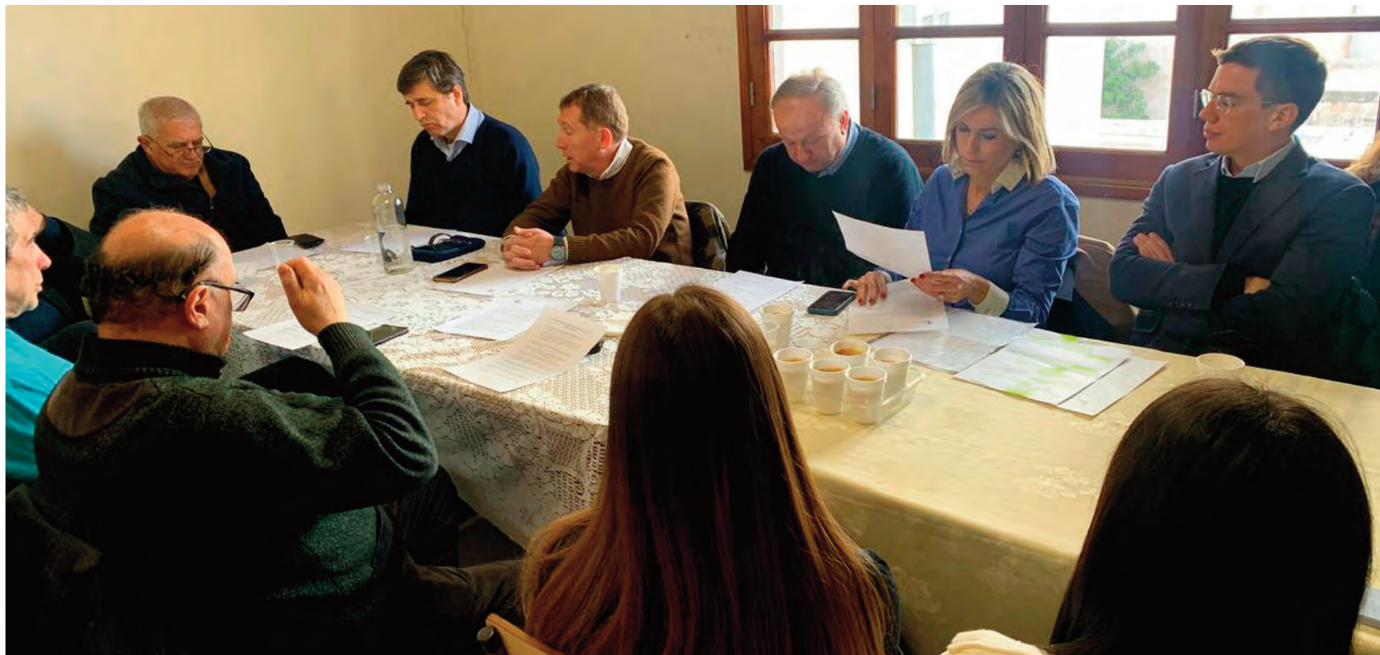
Uriona, en reunión con los legisladores por el juego online.