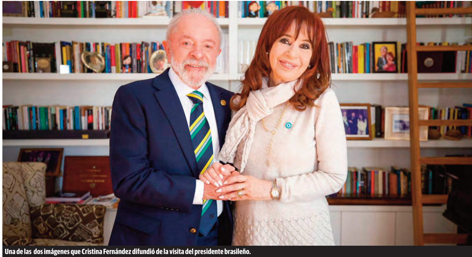
Una de las dos imágenes que Cristina Fernández difundió de la visita del presidente brasileño.

Cristina recibió a Lula: "Un gesto más personal que político"