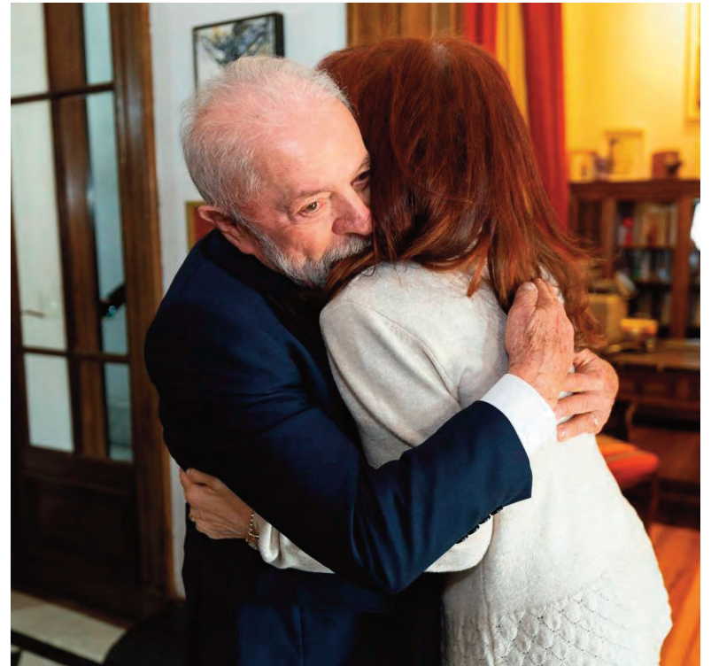
Cristina y Lula se reunieron durante una hora.

Para finalizar, remarcó que “están convirtiendo al país en un experimento continental”, y com-