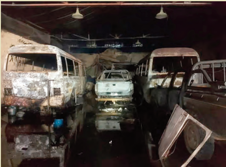
Investigan las causas que originaron el incendio estructural del galpón.

Investigan las causas del siniestro. Intervinieron bomberos locales y de Villa General Belgrano