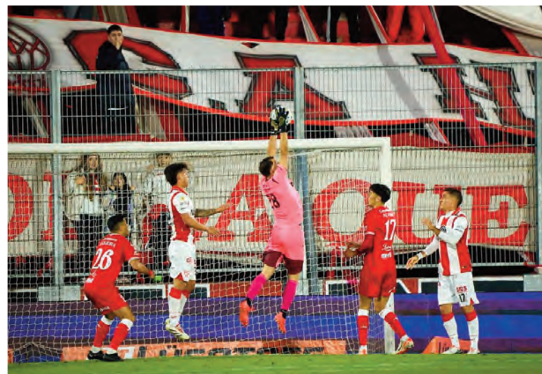
En un partido bastante parejo, Huracán eliminó por penales a Instituto.