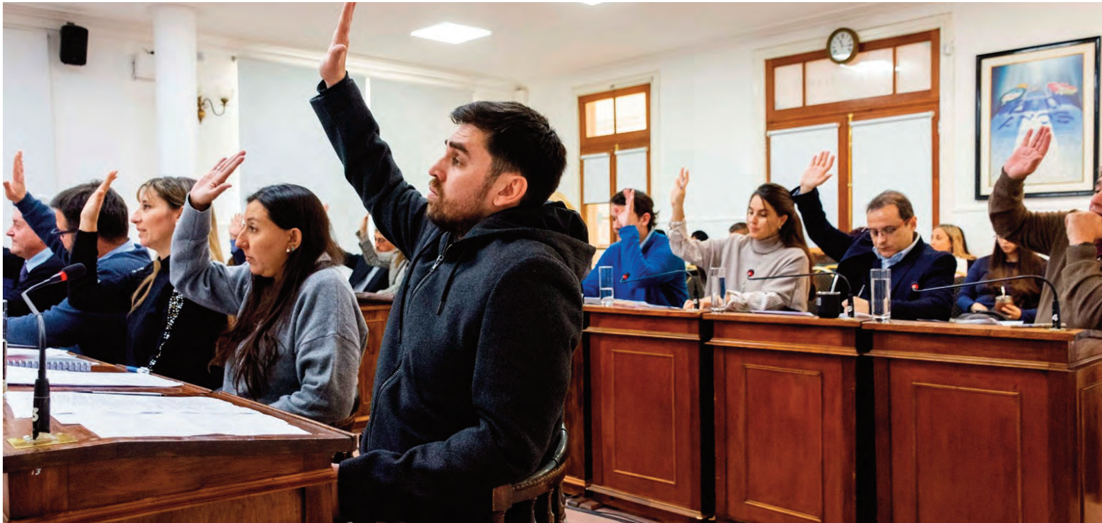
Por amplia mayoría, el Concejo salió a defender a las universidades.