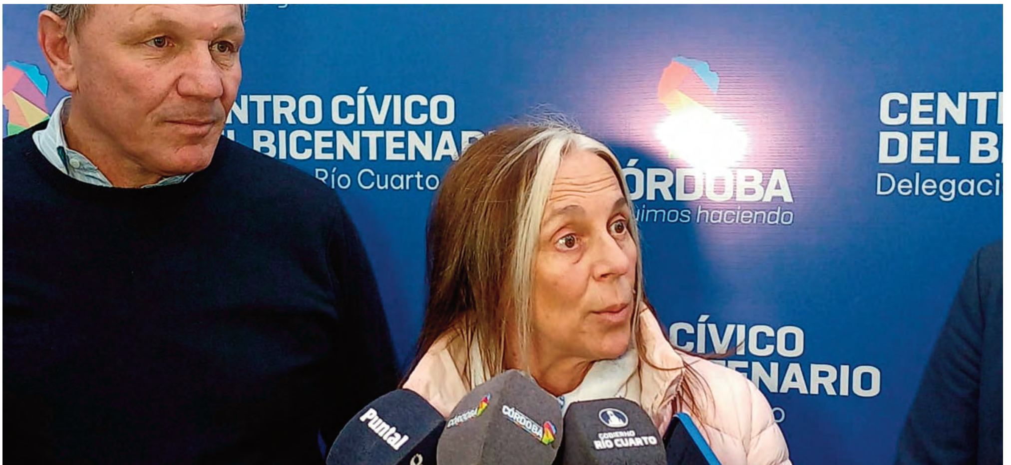
La ministra Montero junto al intendente De Rivas.