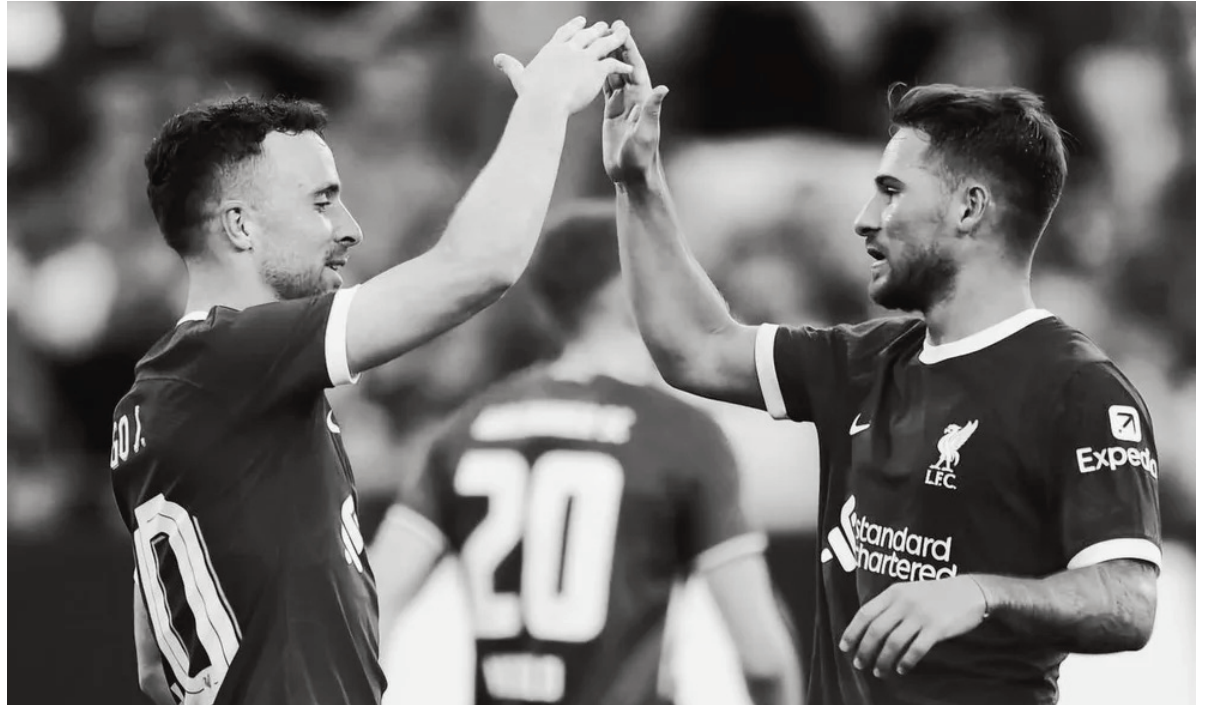
Diogo Jota con su compañero en el Liverpool, el argentino Alexis Mac Allister.