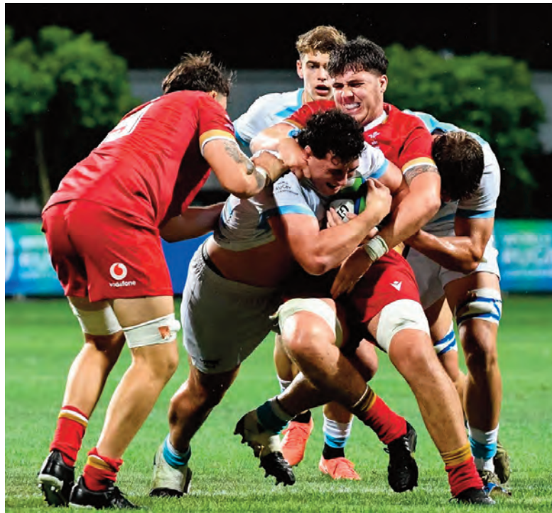
Los Pumitas ganaron en el debut del Mundial, vencieron a Gales.