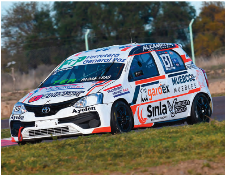
Alejo Cravero, el mejor cordobés ubicado en el campeonato de la Clase 2 del TN Apat.