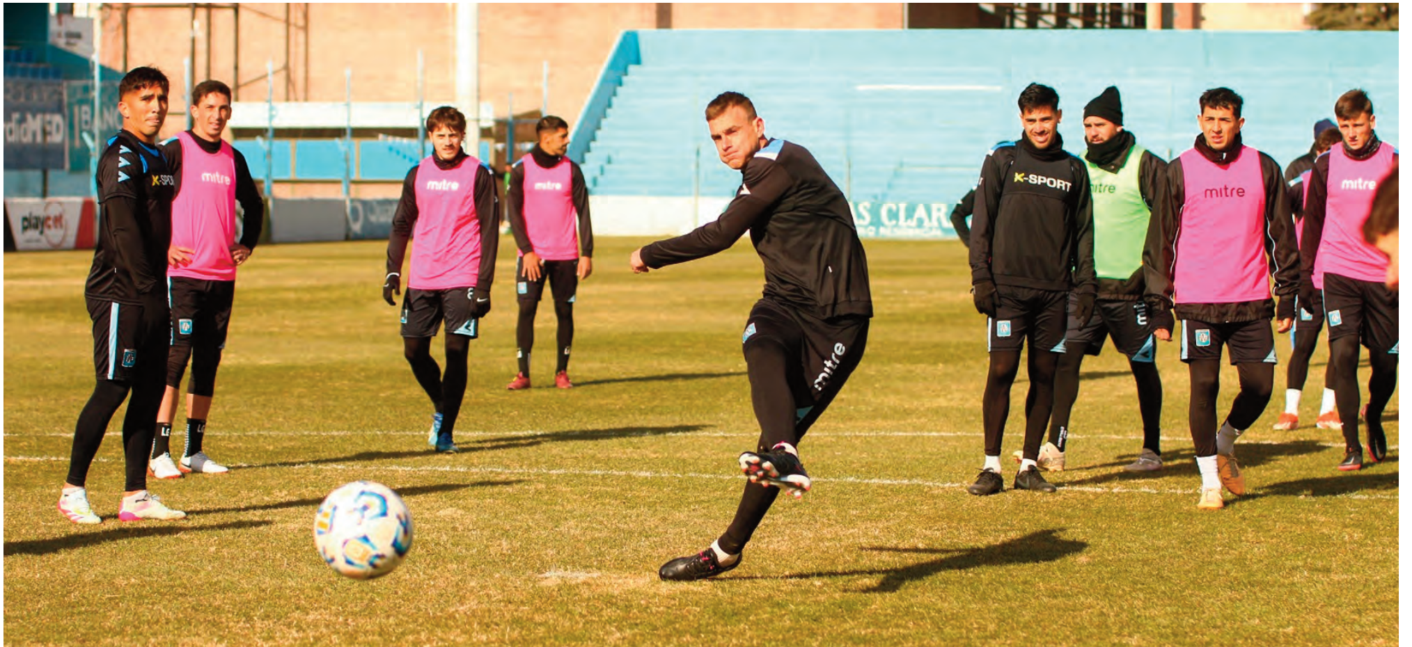
En la competencia, Estudiantes viene de empatar con Agropecuario, mientras que San Telmo tuvo su último partido postergado.