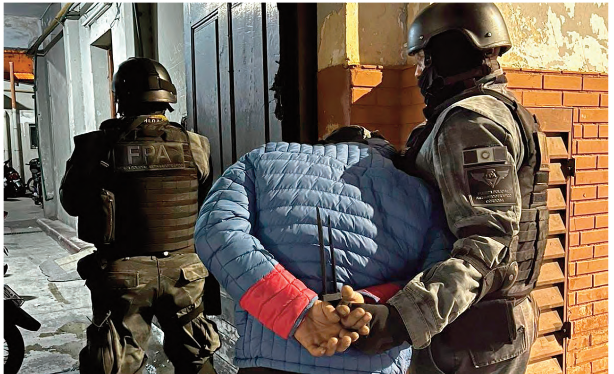
El sujeto detenido en barrio Alberdi fue trasladado a la Alcaldía de la Unidad Departamental.

El procedimiento realizado por la Fuerza Policial Antinarco tráfico se concretó en Tucumán al 1600. Incautaron plantas de marihuana